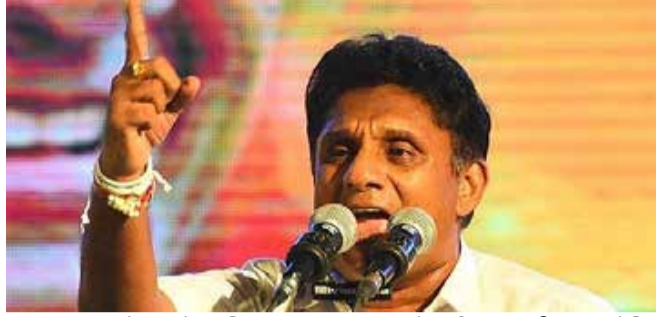
நாட்டு மக்களின் அமோக ஆணையுடன் புதிய ஆட்சியமைத்தே தீருவோம் என்று எதிர்க்கட்சித் தலைவர் சஜித் பிரேமதாஸ் தெரிவித்தார்.