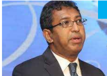
ஹர்ஷ டி சில்வா சாட்டை

நிறுவனத்தின் 4 ஆவது அத்தியாயத்தின் பிரகாரம் இலங்கையின் பொருளாதாரம் தொடர்பில் மேற்கொண்ட மதிப்பீட்டு அறிக்கையை வெளியிட்டுள்ளது.