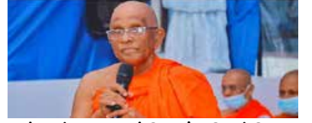
னர் ஒன்றுகூடவுள்ளோம். இதன்போது அரசு தொடர்பில் தீர்மானம் எடுக்கப்படும் - என்றார்.

இது தொடர்பில் ஊடகங்களிடம் அவர் மேலும் கூறியதாவது:- எதிர்வரும் 31ஆம் திகதி மஹாசங்கத்தி