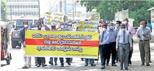
தமக்கு உரிய பாதுகாப்பு வழங்கும் உள்ளிட்ட பல்வேறு கோரிக்கைகளை முன்வைத்து அரசாங்க காலநடை மருத்துவர்கள் சங்கத்தினர் கொழும்பு கோட்டை ரயில் நிலையத்துக்கு முன்பாக நேற்று (28) ஆர்ப்பாட்டம் செய்துள்ள ஊனாதிபதி செயலகம் வரை பேரணியாக சென்றனர்.

கொள்வனவு செய்யப்படும் பாளங்கள் தொடர்பில் அதில் குறிக்கப்பட்டுள்ள விடயங்களை குறித்து கூடுதல் கவனம் செலுத்தப்பட வேண்டும். கலப்படம் செய்யப்பட்ட பலசூக்கு வகைகள் சந்தைப்பில் இருக்கக்கூடும் என்பதால், அவற்றை கொள்வனவு செய்யும்பொழுது அதன் மனம், நிறம் உள்ளிட்ட விடயங்களில் பொது மக்கள் அவதானம் வெலுதல் வேண்டும். இந்த நடவடிக்கைக்காக 49 பரிசீலனர்கள் மற்றும் 6 வைத்திய அதிகாரிகள் உள்ளடக்கிய குழு நடவடிக்கைகளை முன்னெடுக்கும். இதேவேளை, இவ்வாறான பொருட்கள் தொடர்பில் வியாபாரிகளும் அலுவலர்களுடன் செயற்பட வேண்டும் என்றும் குறிப்பிட்டுள்ளனர்.