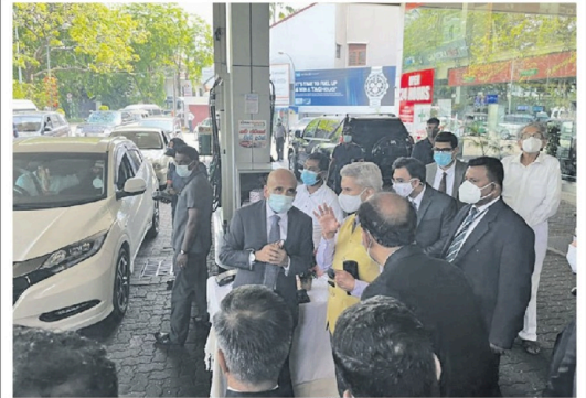
உத்தியோகபூர்வ விஜயம் மேற்கொண்டு இலங்கை வந்துள்ள இந்திய வெளிவிவகார அமைச்சர் ஜய்ஷங்கர், நேற்று கொழும்பிலுள்ள லங்கா ஐ.ஓ.சி. எரிபொருள் நிலையமொன்றுக்கு சென்று நிலைமைகளை பார்வையிட்டார்.