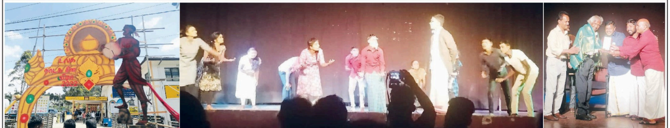
உலக நாடக தினத்தை முன்னிட்டு நுவரெலியா அரசாங்கமும், பரிசீலனை திருத்தவல் கல்யாணிகள் நாடக மன்றத்தினும் இணைந்து நுவரெலியா பரிசீலனை கல்யாணிகள் செயலமர்வுகள் மண்டபத்தில் நாடக தினம் கொண்டாட்டம். இதன்போது நாடக நடப்பதில் ஆர்வமுள்ள இளைஞர்களும் கலந்துகொண்டனர். (டபிள்: க. டி.சுந்தர், செ.வி.பாசில்)

நாட்டின் வளங்கள் விற்கப்படுவது குறித்து முன்னாள் எம்.பி. டி.வி. சென்னன் கருத்து. நாட்டின் வளங்கள் விற்கப்படுவது குறித்து முன்னாள் எம்.பி. டி.வி. சென்னன் கருத்து.