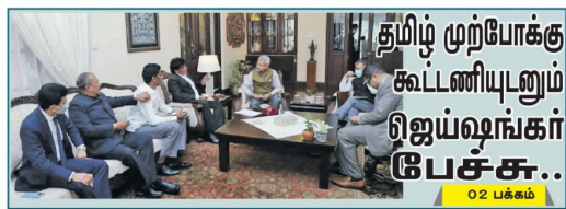
தமிழ் முற்போக்கு கூட்டணியுடனும் ஜய்ஷங்கர் பேச்சு..