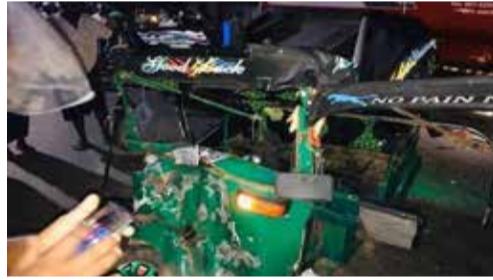
நோக்கிச் சென்று கொண்டிருந்த சாய்ந்த மருது பெற்றோல் முகவர் நிலைய அதிபர்

அக்கரைப்பற்றில் இருந்து சம்மாந்துறை நோக்கிச் சென்று கொண்டிருந்த ஓட்டோவும் கல்முனையில் இருந்து அக்கரைப்பற்று