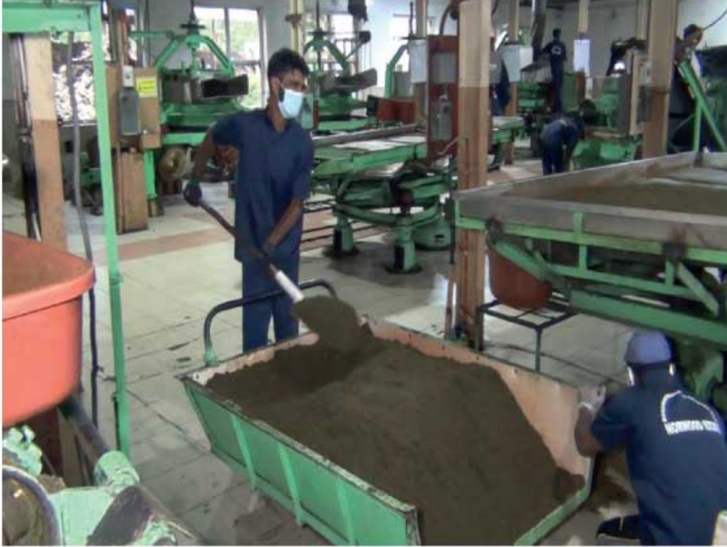
குறித்த இயந்திரத்துக்காக நாளொன்றுக்கே பாரிய தொகை உச்சல் தேவையென தோட்ட முகாமையாளர்கள் தெரிவிக்கின்றனர்.

நாடளாவிய ரீதியிலான மின் துண்டிப்பு, 10 மணித்தியாலங்கள் நீடிக்கப்படுதல், தேயிலைத் தொழிற்சாலைகளுக்கு தேவையான உச்சல் கிடைக்காமல் போன்ற காரணங்களால் இன்றிலிருந்து (31) தேயிலைத் தோட்டங்களின் அன்றாட செயற்பாடுகளை இடைநிறுத்த நடவடிக்கை எடுக்கப்பட்டுள்ளதாக தோட்ட முகாமையாளர்கள் தெரிவித்துள்ளனர். நாளைத் தான் துண்டிப்புத் தேயிலைத் தொழிற்சாலையின் தேயிலைத் துள் உற்பத்தியானது, மின் பிறப்பாக்கி இயந்திரம் மூலமே முன்னெடுக்கப்படுவதாகவும்