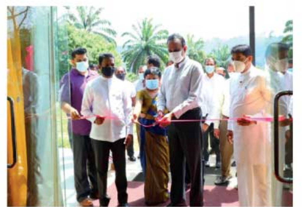
அதேபோல கித்தல், தேங்காய் உள்ளிட்ட ஏனைய பொருட்களுக்கும் பாரிய கேள்வி உள்ளது. எனவே, நாம் இந்த ஏற்றுமதி வருமானத்தை அதிகரித்து, டொலர் பிரச்சினைக்குத் தீர்வைத் தேட எதிர்நோக்கின்றோம். வெளிநாடுகளிலிருந்து இறக்குமதி செய்யப்படும் மஞ்சள் உள்ளிட்ட பயிர்களை நிறுத்தி, இலங்கையில் அதனை பயிரிட நடவடிக்கை எடுத்தோம். அதனால் இன்று உள்ளூர் உற்பத்தியாளர்களின் வருமானம் அதிகரித்துள்ளது என்றார்.

ஏற்றுமதி பயிர்கள் தொடர்பான மேலதிக ஆய்வுக்காக, பெருந்தோட்டத்துறையுடன் தொடர்புடைய பெருந்தோட்ட ஆராய்ச்சி பல்கலைக்கழகமொன்றை ஆரம்பிக்க அமைச்சரவையில் கோரிக்கை முன்வைக்கப்பட்டுள்ளதாக பெருந்தோட்டத்துறை அமைச்சர், ரமேஸ் பத்திரன் தெரிவித்துள்ளார்.