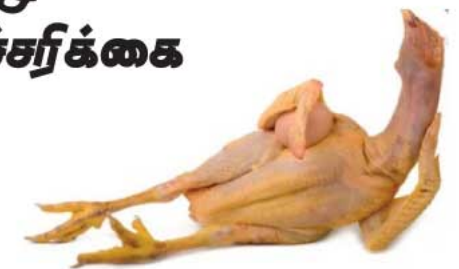
எனவே, மாத்தளை மாவட்டத்தில் குறைந்த விலையில் கோழி இறைச்சி

மாத்தளை மாவட்டத்தில் கோழி பண்ணைகளில் உயிரிழக்கும் கோழிகளை, குறைந்த விலையில் விற்கும் செயற்பாடு முன்னெடுக்கப்படுவதாகவும், கோழி இறைச்சியின் விலை அதிகரிப்பை அடுத்தே, இவ்வாறு விற்பனை செய்யப்படுவதாகவும் கூட்டிக்காட்டப்பட்டுள்ளது.