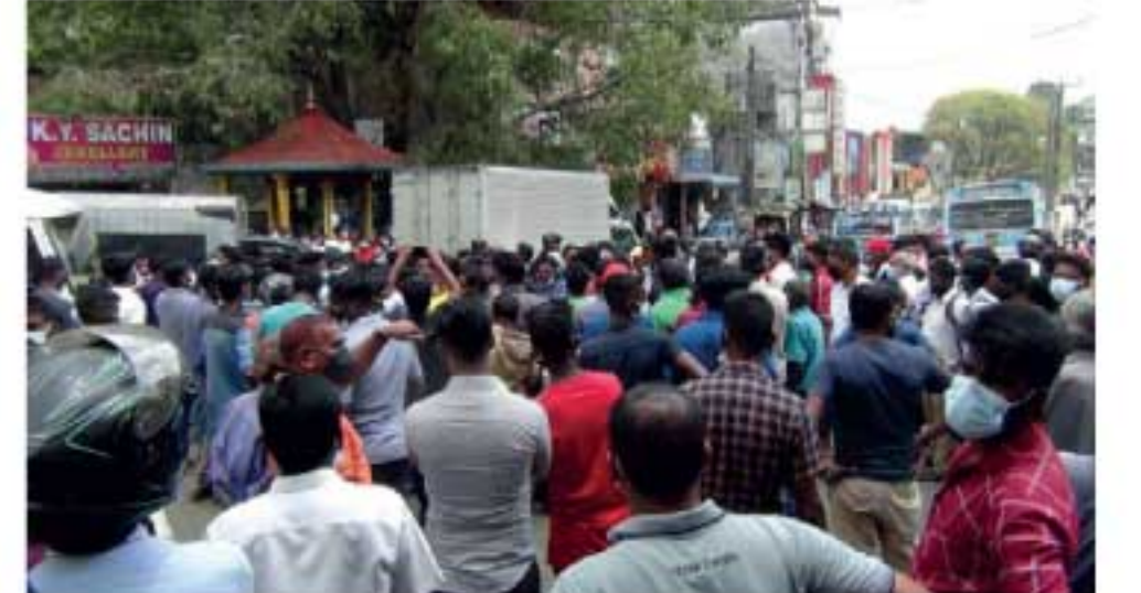
நிறுத்தப்பட்டது. எனினும், நேற்று (30) காலை 9 மணிக்கு உச்சல் விநியோகிக்கப்படும் என உறுதியளிக்கப்பட்டது. அந்த உறுதி மீறப்பட்டதால் சாரதிகள் வீதிக்கு இறங்கி போராடத் தொடங்கினர். இதனால், ஹட்டன் பஸ் தரப்பிடத்தில் இருந்து வெளிமாவட்டங்களுக்கு புறப்பட்ட இலங்கை போக்குவரத்துச் சபைக்கு சொந்தமான பஸ்கள், பல மணிநேரம் நிறுத்திவைக்கப்பட்டிருந்தமை குறிப்பிடத்தக்கது.

ஹட்டன் நகரிலுள்ள எரிபொருள் நிலையத்தில் உச்சல் பெற்றுக்கொள்வதற்கு நேற்று முன்தினம் (29) மாலை முதல் சாரதிகள் காத்திருந்தனர். எனினும், இறுதி நேரத்தில் உச்சல் இல்லையென அறிவிக்கப்பட்டுள்ளது. இதனால் ஆத்திரமடைந்த சாரதிகள், பொதுமக்களுடன் இணைந்து ஹட்டன் மணிக்கூட்டு கோபுரம் சந்தியில் நேற்றுமுன்தினம் (29) இரவு போராட்டத்தில் ஈடுபட்டனர். இதனால் பெரும் பதற்றம் ஏற்பட்டது. பொலிஸாரின் தலையீட்டுடன் போராட்டம்