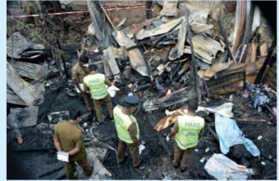
தெரிவித்தனர். உயிரிழந்த யுவதியின் காதலனாலேயே தீப்பற்ற வைக்கப்பட்டுள்ளமை விசாரணைகளில் மூலம் தெரியவந்துள்ளமை குறிப்பிடத்தக்கது.