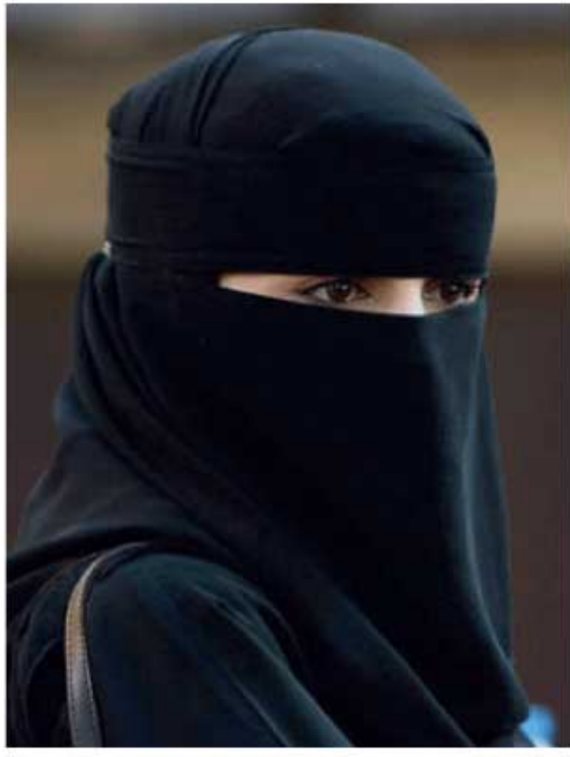
பாடசாலைகளில் பொதுத் தேர்வு நடைபெறும் நிலையில், ஹிஜாப்

கர்நாடகத்தில் ஹிஜாப் அணிந்த மாணவிகளைப் பரீட்சை எழுத அனுமதித்த 7 ஆசிரியர்கள் பணி நீக்கம் செய்யப்பட்டுள்ளார்கள். பாடசாலை, பல்கலைக்கழகங்களில் முஸ்லிம் மாணவிகள் ஹிஜாப் அணியக்கூடாது என மாநில அரசு விதித்த தடையை, கர்நாடக உயர்நீதிமன்றம் உறுதி செய்துள்ளது. இதையடுத்து பாடசாலை, பல்கலைக்கழகங்களில் ஹிஜாப் அணிந்த மாணவிகள், பரீட்சை மண்டபத்துக்கு உள்ளே அனுமதிக்கப்படவில்லை. இந்நிலையில், தற்போது