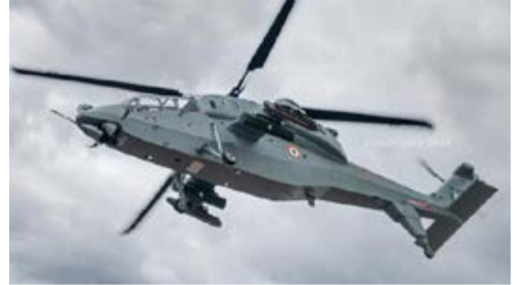
3,887 கோடி ரூபாலில் போர் ஹெலிகொப்டர்கள் வாங்குவதற்கு இந்திய பாதுகாப்பு அமைச்சரவை முடிவு

இரண்டு ஆண்டுகளில் வரும் என்பதை மனதில் வைத்துக் கொள்ளவும். ஏனென்றால் நம் முடைய பொருளாதாரக் கொள்கை அப்படி உள்ளது. அனைத்தையும் தனியாருக்கு தாரை வார்த்துக்கொடுத்தால் நிலைமை அப்படித்தான் ஆகும், என்று கூறியிருக்கிறார்.