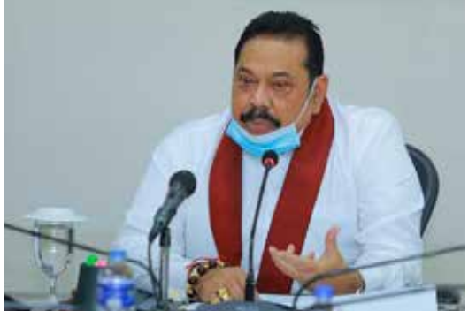
இடைத்தங்கல் முகாம்கள் செயற்பட்டுவந்தன. வடமாகாண சுகாதார சேவைகள் பணிமனையில் பல ஊழல் மோசடிகள் இடம்பெற்றுவருகின்றமை தொடர்பாகக் குற்றச்சாட்டுகள் எழுந்துள்ளமையும் குறிப்பிடத்தக்கது.

வடமாகாண சுகாதார அமைச்சு மற்றும் மாகாண சுகாதார சேவைகள் பணிப்பாளர் ஆகியோரின் கண்காணிப்பில் இந்தக் கொரோனா