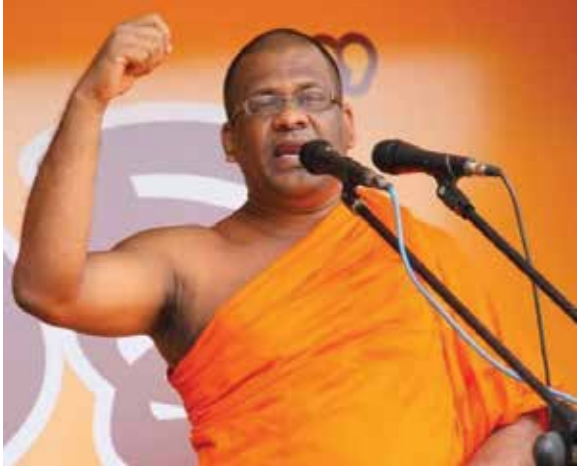
இந்த நாட்டை ஆட்சி செய்ய முடியாவிட்டால் ஆட்சி செய்யும் திறமையுடையவர்களிடம் அந்தப் பொறுப்பை ஒப்படைக்க வேண்டுமென பொதுபலசேனா இயக்கத்