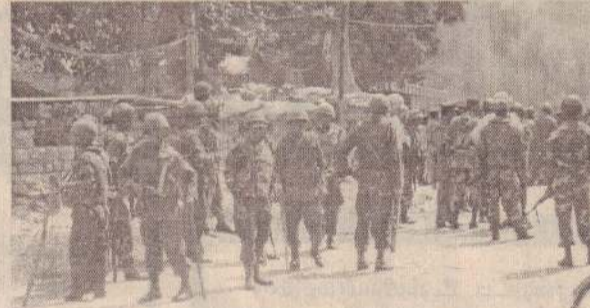
மடத்தடியில் கற்ற பாடம்