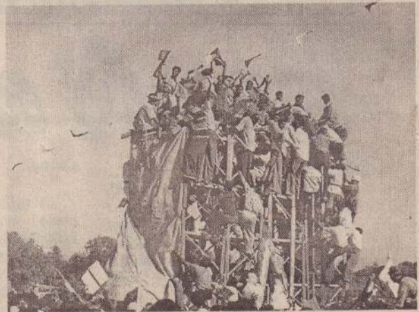
உரிமைக்காக திரண்ட மக்கள்