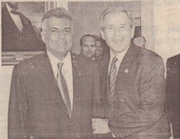
புலி கிருக்கப் பயம் ஏன்?