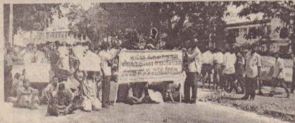
வாழ்விட உரிமைக்கான போராட்டம்