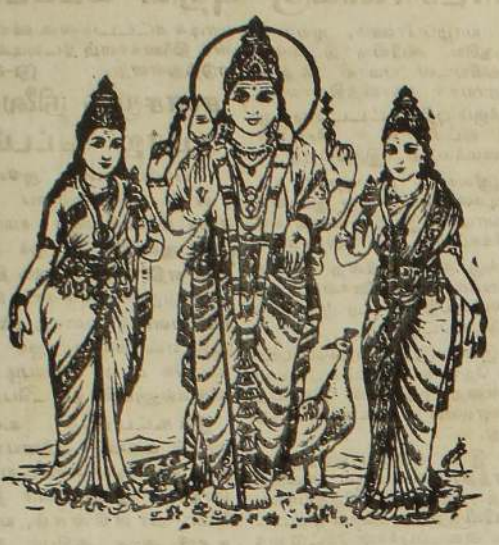
மஞ்சவனப்பதியில் வாழும் வரமணியே! தஞ்சமென நின்றால் சரணடைந்தேன்— செஞ்சொகுணபதியே! ஞானக்குருபரே! செல்வக் கணபதியே! காப்பாய் களிந்து

[மஞ்சவனப்பதி முருகன் மீது திருமுருகிருபானந்த வாரியார் பாடியது]