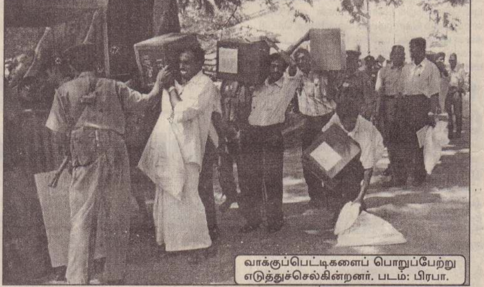
வாக்குப்பெட்டிகளைப் பொறுப்பேற்று எடுத்துச்செல்கின்றனர்.

அரசாங்கப்பற்ற நிறுவனம் ஒன்றினால் வழங்கப்பட்ட படகு ஒன்றில் இந்த மீனவர்கள் மூவரும் செவ்வாய் இரவு மீன்பிடிக்கச் சென்றனர். கரையில் இருந்து சுமார் 16 கடல்மலை தொலைவில் படகு சென்றுகொண்டிருந்த வேளை திடீரென அது உடைந்தது. இதனால் அதிலிருந்து மூன்று மீனவர்களும் கடலில் விழுந்தனர். எனினும் தெய்வாதீனமாக மூன்று மீனவர்களும் நீந்திக் கரைசேர்ந்தனர். (8-173)