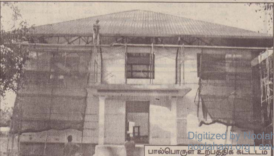
பால்பொருள் உற்பத்திக் கட்டடம்

தொழிற்சாலையின் திறப்பு விழா விரைவில் நடைபெறும் எனத் தெரிவிக்கப்பட்டது. (த-352-202)