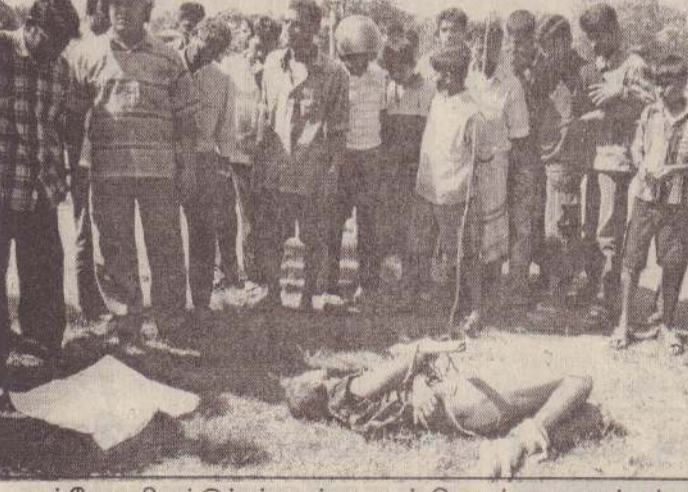
பல்வேறு திருட்டுச்சம்பவங்களுடன் தொடர்புடையவர் என்று கருதப்படும் இளைஞர் பொதுமக்களால் தாக்குண்டு உயிரிழந்தார். யாழ்ப்பாணம். இந்துக் கல்லூரி மைதானத்தில் கிடந்த அந்த இளைஞரின் சடலத்தைப் பொதுமக்கள் கூடிநின்று பார்வையிடுவதைப் படத்தில் காணலாம்.

வடமராட்சி, நவ.17 வடமராட்சியில் தேர்தல் கண்காணிப்பாளர்களின் அலுவலகம் வடமராட்சி வடக்கு கடற்றொழிலாளர் கூற்றவுச்சங்கச்சமாசக் காரியாலயத்தில் செயற்படவுள்ளது. இன்று நடைபெறும் ஜனாதிபதித் தேர்தலின்போது வடமராட்சிக்கான பிரதேசக் கண்காணிப்பு நிலையமாக இன்று காலை 6 மணிமுதல் இரவு 7 மணிவரை மேற்படி சமாசக் காரியாலயத்தின் ஒருபகுதி செயற்படும் என்று வடமராட்சி வடக்கு கடற்றொழிலாளர் கூட்டுறவுச் சங்கங்களின் சமாசம் தெரிவித்துள்ளது. (ஓ-70)