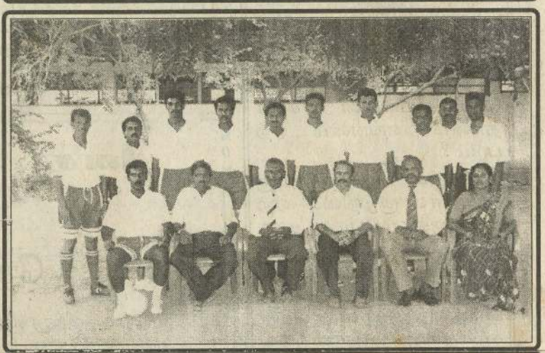
இலங்கைத் தமிழர் ஆசிரியர் சங்கத்தின் யாழ்ப்பாணம் மாவட்டக் கிணையினரால் நடத்தப்பட்ட கர்ப்பந்தாட்டப் போட்டியில் முதலிடம் பெற்ற ஆசிரியர் கலாசாலை அணியினரைப் படத்தில் காணலாம்.

யாழ்ப்பாணம்-கண்டி... கோரியுள்ள 3அரைக் கோடி ரூபாவை வழங்கி பாதை திறப்பதற்கு வேண்டிய பாதுகாப்பு ஏற்பாடுகளை மேற்கொள்ளுமாறும் பிரதமர் உத்தரவிட்டுள்ளார். பாதைதிறப்பதற்கான பணத்தையும் இராணுவச் சோதனைச் சாவடிகள் மற்றும் கட்டடங்கள் அமைப்பதற்கான பணத்தையும் புனர்வாழ்வு அமைச்சில் கடனாகப் பெற்றுக்கொள்ளுமாறும், கண்டியாழ்ப்பாணம் வீதி திறப்பது தொடர்பாக இந்து கலாசார அமைச்சர் தி.மகேஸ்வரனுடன் தொடர்பு கொண்டு அவருடன் கலந்தாலோசித்து மேலதிக நடவடிக்கைகளை எடுக்குமாறும் பிரதமர் பணித்துள்ளார். யாழ்ப்பாணம் வீதி திறப்பது தொடர்பாக பாதுகாப்பு அமைச்சர் திலக்மாரப்பனவும் முப்படைத் தளபதிகளும் கடந்த ஞாயிற்றுக்கிழமை எழுதுமட்டுவாளுக்குச் சென்று இராணுவத்தினருடன் கலந்துரையாடியமை தெரிந்ததே. இதே வேளை, கடந்த மாதம் 15 ம் திகதி வவுனியாவில் இருந்து கிளிநொச்சி வரையிலான கண்டிவீதி பயணிகள் போக்குவரத்திற்கு திறந்து விடப்பட்ட சமயம் யாழ்ப்பாணத்திற்கான பாதைத் திறப்பில் இழுபறிநிலை காணப்பட்டமையும் இங்கு குறிப்பிடத்தக்கது. (வ)