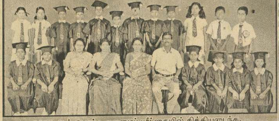
2009 ஆம் ஆண்டு புலமைப் பரிட்சையில் சித்தியடைந்த, 100 புள்ளிகளுக்கு மேல் பெற்ற மாணவர்கள் பிரதி அதிபர், ஆசிரியர்களுடன்