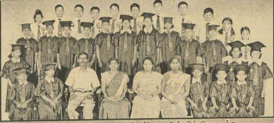
2008 ஆம் ஆண்டு புலமைப் பரிட்சையில் சித்தியடைந்த, 100 புள்ளிகளுக்கு மேல் பெற்ற மாணவர்கள் பிரதி அதிபர், ஆசிரியர்களுடன்