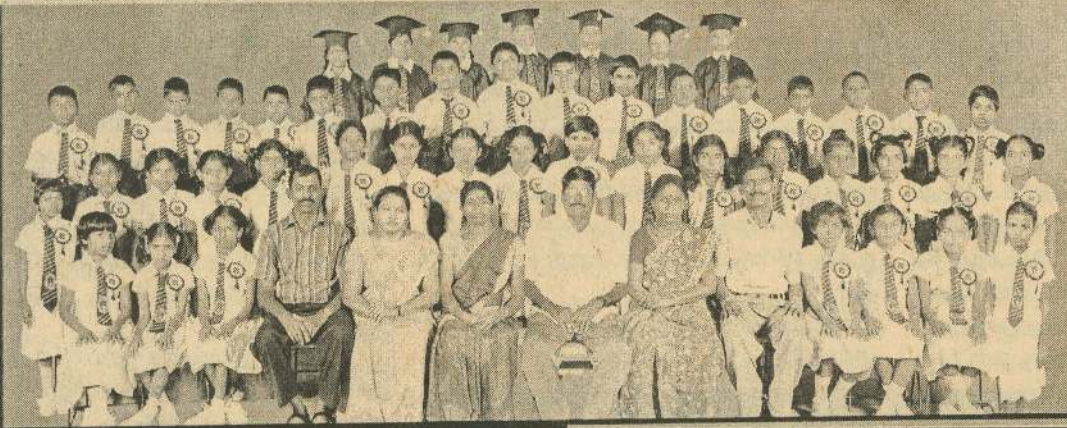
2010 ஆம் ஆண்டு புலமைப்பரிசில் பரிட்சையில் சித்தியடைந்த, 100 புள்ளிகளுக்கு மேல் பெற்ற மாணவர்கள் பிரதி அதிபர் ஆசிரியர்களுடன்