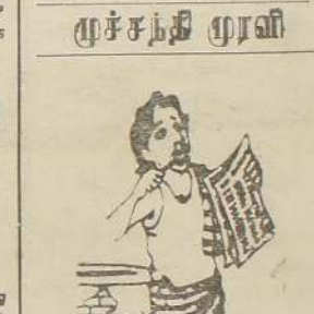
தேர்தல் ஸ்ரீரங்கம் என்ற உலக வங்கிக்குத் தேர்தல் போர்த்து போலீஸ்.....! (இ-3)