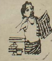
அப்ப... ஈழத்தமிழர் புதுயுக்தி

ஐரோப்பிய நாடுகளுக்கு செல்ல ஈழத்தமிழர் புதுயுக்தி கொழும்பு, ஏப். 28 ஐரோப்பிய நாடுகளுக்கு செல்ல ஈழத்தமிழர் புதுயுக்தி. (உ-5)