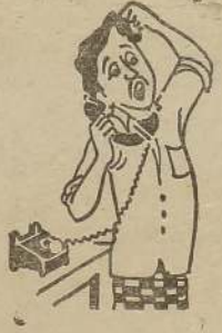
வெளிநாட்டுத் துருப்புக்கள் இலங்கையிலே மாறி மாறி இருக்கவேண்டும் என்று ஒரு நியதி உண்டோ யாருக்குத் தெரியும்...!

கௌஹாத்தியில் செய்தி யாளர் மத்தியில் பேசுகையி லேயே திரு. ராஜீவ் காந்தி இவ்வாறு தெரிவித்தார். அவர் சொன்னதாவது:- விடுதலைப் புலிகளுக்கும் இலங்கை இராணுவத்திற்கும் இடையே புதிதாக ஏற்பட்டுள்ள யுத்தத்தைத் தொடர்ந்து ஏற்பட்டுள்ள நிலைமையைச் சமாளிக்க பாகிஸ்தான் தனது துருப்புக்களை அனுப்பக்கூடும். இந்தியாவுடன் நட்புறவு கொண்டிருக்கிற பாகிஸ்தான் போன்ற நாடுகளின் உதவியை இலங்கை அரசு நாடியுள்ளது. முன்னர் ஒருமுறை நான் பிரதமர் சிங்கைச் சந்தித்த போது இதுபற்றி அவரிடம் கூறினேன். அப்போது அவர், 'பாகிஸ்தான் துருப்புக்களை அனுப்பாது; ஆனால் பொருள்களை அனுப்பி உதவலாம்' என்று கூறினார். இந்திய - இலங்கை உட்பந்தம் முழுமையாக அமுல் நடத்தப்பட்டிருந்தால் இந்த நிலை ஏற்பட்டிருக்காது - என்றார். (அ-எ)