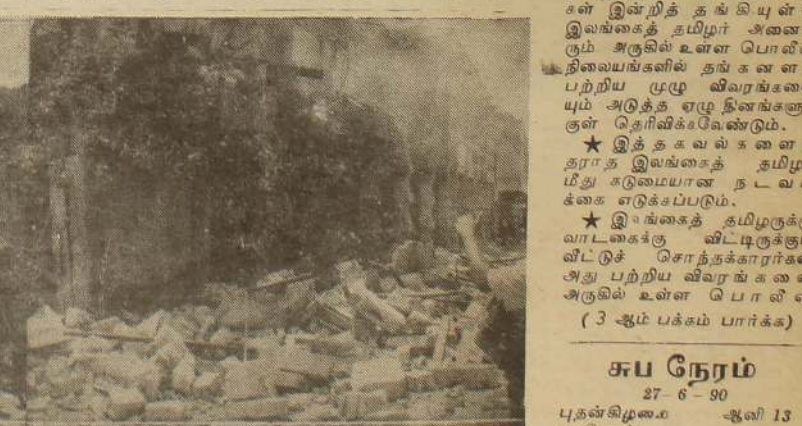
போர் விமானங்களின் குண்டு வீச்சுக்கு இலக்கான யாழ். நகரின் சந்தைக் கட்டடத்தின் சில கடைகள் எரிந்து கொண்டிருக்கும் காட்சி படங்கள்: கே. எஸ். ஆர்.

சென்னை, ஜூன் 27 தமிழகத்தில் தங்கியிருக்கும் இலங்கைத் தமிழர்கள் தம்மைப் பற்றிய முழு விவரங்களையும் ஏழு தினங்களுக்குள் அறிவிக்கவேண்டும் என்று தமிழக அரசு கண்டிப்பான உத்தரவு பிறப்பித்திருக்கிறது. தமிழகத்தில் இலங்கைத் தமிழர்களின் நடமாட்டத்தைக் கட்டுப்படுத்த தமிழக அரசு எடுத்துவரும் நடவடிக்கைகளில் இது ஆகப் பிந்தியதாகும். தமிழக அரசின் அந்த உத்தரவில் தெரிவிக்கப்பட்டுள்ளதாவது:- தமிழ்நாட்டில் தங்கியுள்ள இலங்கைத் தமிழர்களின் நடமாட்டத்தைக் கண்டிப்பான நடவடிக்கைகளை எடுக்கவேண்டும். இது சம்பந்தமாக தமிழக அரசு நேற்று உத்தரவு பிறப்பித்தது. ★ 1983 ஆம் ஆண்டு முதல் தமிழகத்தில் உரிய ஆவணங்கள் இன்றித் தங்கியுள்ள இலங்கைத் தமிழர் அனைவரும் அருகில் உள்ள பொலீஸ் நிலையங்களில் தங்களைப் பற்றிய முழு விவரங்களையும் அடுத்த ஏழு தினங்களுக்குள் தெரிவிக்கவேண்டும். ★ இத்தகவல்களைத் தராத இலங்கைத் தமிழர் மீது கடுமையான நடவடிக்கை எடுக்கப்படும். ★ இலங்கைத் தமிழருக்கு வாடகைக்கு வீட்டிருக்கும் வீட்டுச் சொந்தக்காரர்கள் அது பற்றிய விவரங்களை அருகில் உள்ள பொலீஸ் (3 ஆம் பக்கம் பார்க்க)