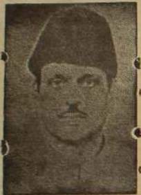
பிரதமர் வி. பி. சிங் சுப நேரம் 29-6-90 வெள்ளிக்கிழமை ஆனி 15 சுபநேரம்: 05-56-07-26 இராசுகாவம் 10-26-11-56

புதுடில்லி, ஜூன் 29 - இலங்கையில் விடுதலைப் புலிகளுக்கும், அரசுப் படையினருக்கும் இடையே நடைபெறும் சண்டையை நிறுத்தவும்— அப்பாவித் தமிழ் மக்கள் உயிரிழப்பைத் தடுக்கவும்— இந்தியா புதிய முயற்சிகளை எடுக்க இருக்கிறது. இது தொடர்பான உறுதி மொழியை பிரதமர் வி. பி. சிங் தமிழக முதல்மைச்சர் திரு. மு. கருணாநிதிக்கு நேற்று வழங்கினார். இலங்கையில் தமிழர் இனப்படுகொலைக்கு ஆளாகியிருக்கின்றனர். இதனை நிறுத்துவதற்கான அவசர நடவடிக்கைகளை மத்திய அரசு மேற்கொள்ளவேண்டும். இவ்வாறு திரு. கருணாநிதி அப்போது பிரதமர் திரு சிங்கநாணிக்கு ஆளாகியிருக்கின்றனர். இதனை நிறுத்துவதற்கான அவசர நடவடிக்கைகளை மத்திய அரசு மேற்கொள்ளவேண்டும். இவ்வாறு திரு. கருணாநிதி அப்போது பிரதமர் திரு சிங்கநாணிக்கு ஆளாகியிருக்கின்றனர். இதனை நிறுத்துவதற்கான அவசர நடவடிக்கைகளை மத்திய அரசு மேற்கொள்ளவேண்டும்.