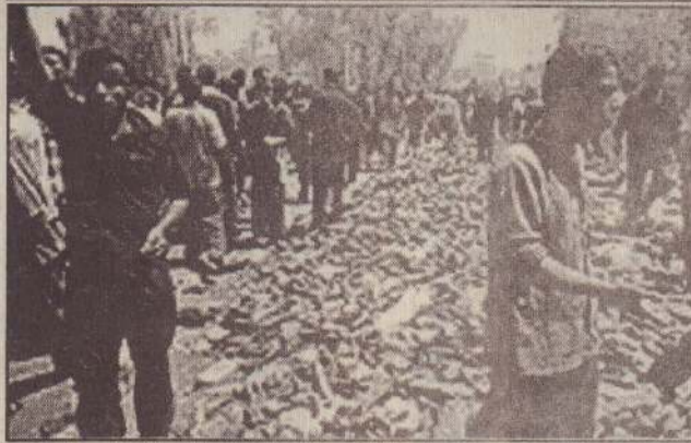
ஈராக் தலைநகர் பக்தாத்தில் வழிபாட்டுத் தலத்தில் ஏற்பட்ட சனநெரிசலில் சிக்கியும் டைகீரிஸ் நதியில் மூழ்கியும் உயிரிழந்த ஆயிரத்துக்கும் அதிகமான யாத்திரிகர்களின் பாதணிகளின் குவியலை படத்தில் காணலாம். (மேலும் செய்தி, படம் 11 ஆம் பக்கத்தில்)