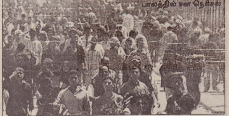
பாலத்தில் சன நெரிசல்

கள் ஊடுருவியுள்ளன வதந்தி பரவியது. இதனால், பீதியடைந்த யாத்திரிகர்கள் முண்டியத்துக் கொண்டு ஒரே நேரத்தில் அங்கிருந்த