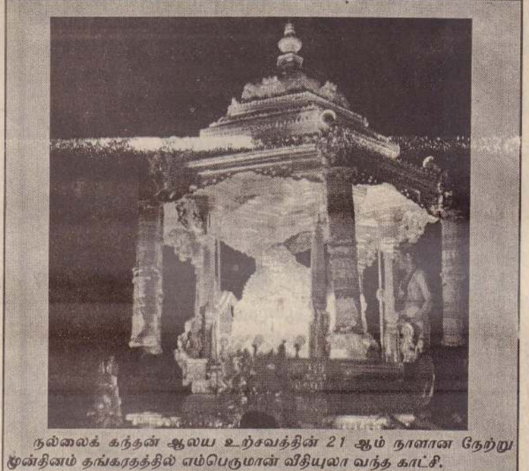
நல்லைக் கந்தன் ஆலய உற்சவத்தின் 21 ஆம் நாளான நேற்று முன்தினம் தங்கரத்தில் எம்பெருமான் வித்யுலா வந்த காட்சி.