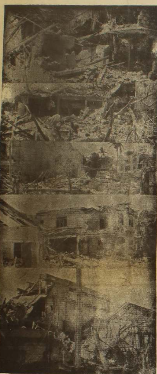
கடந்த வெள்ளியன்று யாழ். நகரில் போர் விமானங்கள் நடத்திய குண்டு வீச்சுத் தாக்குதல்களில் சேதமுற்ற வீடுகளில் சில.