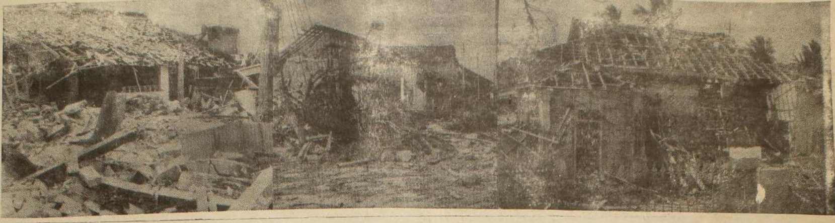
கடந்த வெள்ளியன்று யாழ். நகரில் இடம்பெற்ற போர் விமானக் குண்டு வீச்சில் சேதமுற்ற வீடுகளில் சில. (உ)