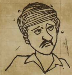
அப்ப பிணினோக்கிப் பாய் கிற நடவடிக்கை ஆரம்பம் என்று சொல்லுகோ!.....