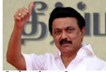
இந்தியப் பிரதமர் மோடி முதலிடத்திலும், உள்துறை அமைச்சர் அமிதஷா இரண்டாமிடத்திலும் ஆர். எஸ். எஸ். தலைவர் மோகன் பகவத் மூன்றாமிடத்திலும்

சென்னை, ஏப். 02 இந்தியாவின் சக்திவாய்ந்த 100 நபர்களின் பட்டியலை அந்த நாட்டின் பிரபல ஆங்கில சஞ்சிகை ஒன்று வெளியிட்டுள்ளது. இதில், தமிழக முதலமைச்சர் ஸ்ராலின் 23ஆவது இடத்தில் இருக்கிறார். 2019 பாராளுமன்றத் தேர்தலுக்கு பிறகு தொடர் வெற்றிகளை ஈட்டியதன்மூலம் அவர் இந்த இடத்தைப் பிடித்துள்ளார். இந்தப் பட்டியலில்