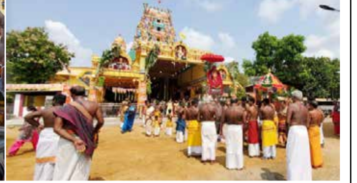
நல்லூர் வடக்கு ஸ்ரீசந்திரசேகர பிள்ளையார் ஆலயத்தின் பெருந்திருவிழா நேற்று வெள்ளிக்கிழமை கொடியேற்றத்துடன் ஆரம்பமானபோது...!