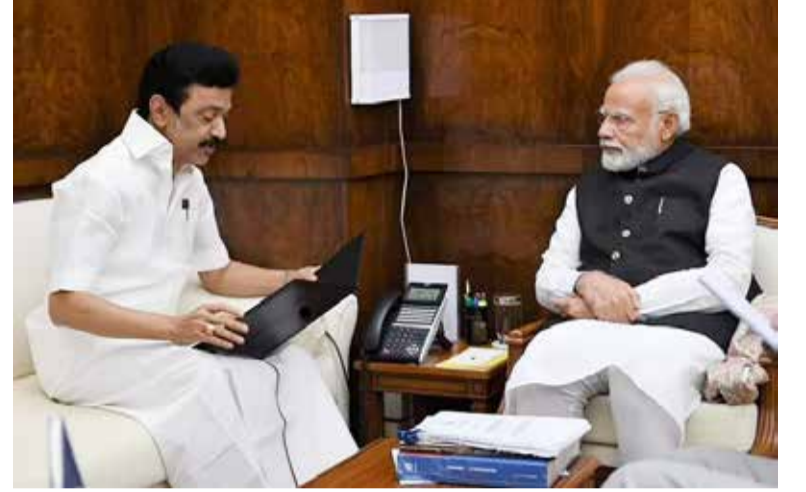
களை "புலம்பெயர்ந்த தமிழர்கள்" என்று அழைக்க எமது அரசு முடிவு செய்துள்ளது.

புதுடில்லி, ஏப். 02 பொருளாதார நெருக்கடியால் பாதிக்கப்பட்டுள்ள ஈழத் தமிழர்களுக்கு உதவிகளை நேரடியாக தமிழக அரசு வழங்குவது தொடர்பான கோரிக்கைகளை பரிசீலிப்பதாக பிரதமர் கூறியுள்ளார் என்று தமிழக முதலமைச்சர் மு. க. ஸ்ராலின் தெரிவித்துள்ளார். புதுடில்லி சென்றுள்ள தமிழக முதல்வர் நேற்று முன்தினம் பிரதமர் மோடியை சந்தித்துப் பேசினார். இதன் பின்னர் செய்தியாளர்களுக்குக் கருத்துத் தெரிவித்தபோதே அவர் மேற்கண்டவாறு கூறினார். அத்துடன், இலங்கை அகதி