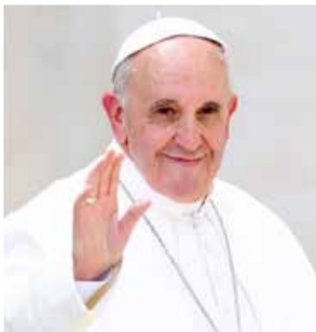
வத்திக்கான், ஏப். 04

கனடாவில் கத்தோலிக்க திருச்சபையால் நடத்தப்பட்ட பழங்குடியின குடியிருப்புப் பள்ளிகளில் பழங்குடியின சிறுவர்களுக்கு இடம்பெற்ற அநீதிகளுக்காக கத்தோலிக்க திருச்சபையின் தலைவரான பாப்பரசர் பிரான்சிஸ் மன்னிப்பு கேட்டுள்ளார்.