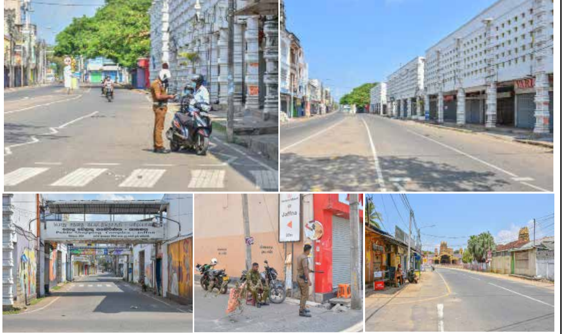
நாடு முழுவதும் இன்று காலை வரை நடைமுறையிலிருந்த ஊரடங்கால் நேற்றைய தினம் யாழ்ப்பாணம் நகரம் முழுமையாக முடங்கியது. ஊரடங்கை மீறிப் பயணித்தவர்கள் பொலிஸாரால் சோதனைக்கு உட்படுத்தப்பட்டனர்.