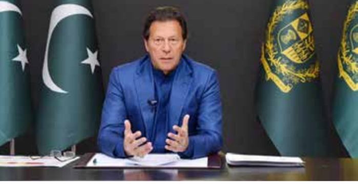
இஸ்லாமாபாத், ஏப். 04

நம்பிக்கையில்லாத தீர்மானத்தில் தோல்வி நிச்சயம் என்ற சூழலில் பாராளுமன்றத்தை கலைத்து தேர்தலுக்குச் செல்லும் முடிவை இம்ரான் கான் கோரிக்கை விடுத்திருந்த நிலையில், இம்ரான் கானின் பரிந்துரையை ஏற்று பாராளுமன்றத்தை கலைத்து பாகிஸ்தான் அதிபர் அறிவித்துள்ளார்.