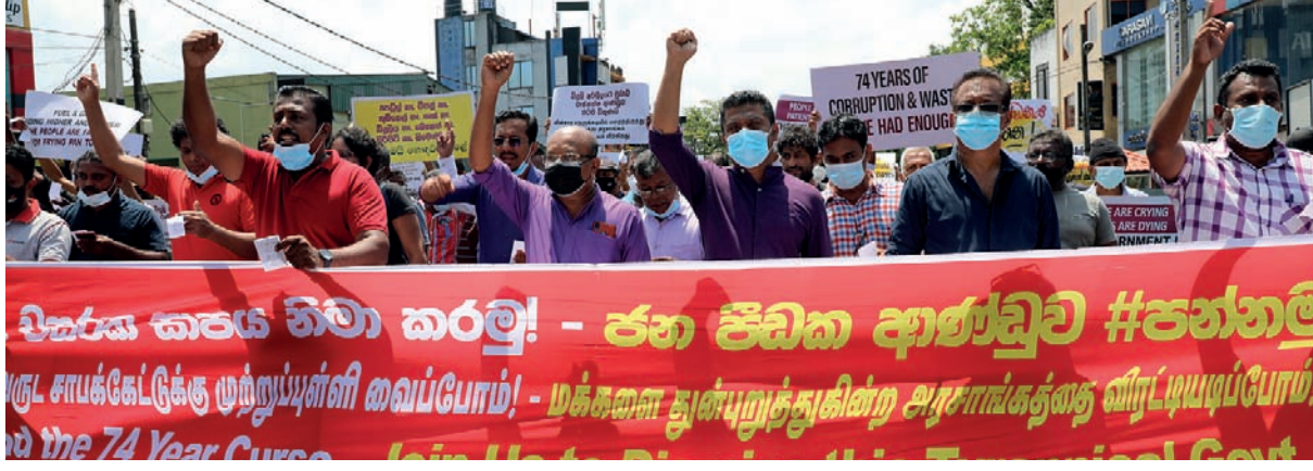
74 வகுட சாபக்கேட்டுக்கு முற்றுப்புள்ளி வைப்போம்

ஊரடங்குச் சட்டம் அமலில் இருந்த நிலையிலும் அரசாங்கத்துக்கு எதிராக, தேசிய மக்கள் சக்தியினர் நேற்று (03) மஹரகமலில் போராட்டத்தில் ஈடுபடுவதைப் படங்களில் காணலாம்