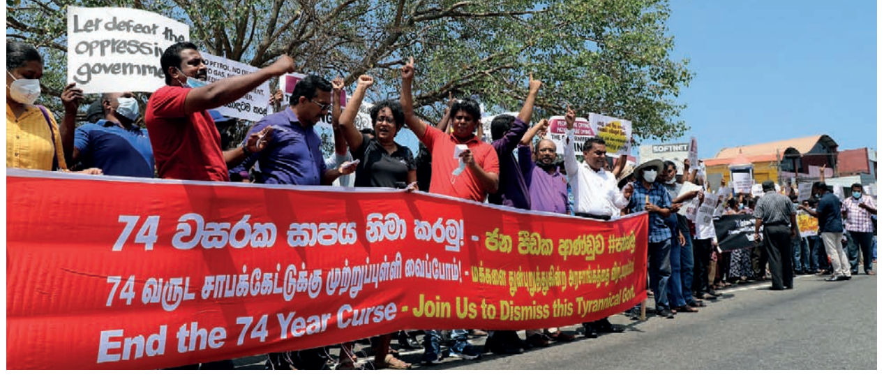
74 வகுட சாபக்கேட்டுக்கு முற்றுப்புள்ளி வைப்போம்

ஊரடங்குச் சட்டம் அமலில் இருந்த நிலையிலும் அரசாங்கத்துக்கு எதிராக, தேசிய மக்கள் சக்தியினர் நேற்று (03) மஹரகமலில் போராட்டத்தில் ஈடுபடுவதைப் படங்களில் காணலாம்