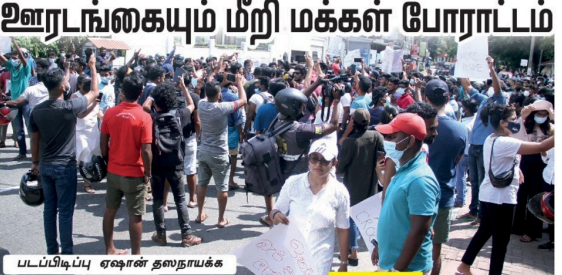
02 பக்கம்