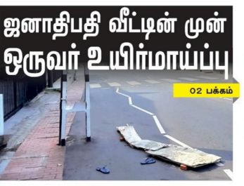
ஐராதிபதி வீட்டின் முன் ஒருவர் உயிர்மாய்ப்பு 02 பக்கம்

அமைச்சர் நாமலின் குடும்ப உறுப்பினர்கள் நாட்டிலிருந்து வெளியேற்றும் 02 பக்கம்