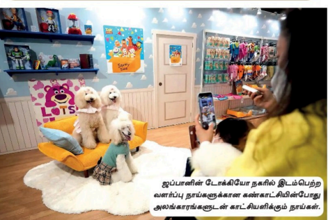
ஐப்பாளின் டெக்னியோ நகரில் இடம்பெற்ற வளப்பு நம்ம்கூட கண்காட்சியின்மேல் அலங்காரங்களை காட்சியளிக்கும் நம்ம்கூட.

மியான்மரில் நடக்கும் இராணுவ ஆட்சியை ஆதரிப்போம் என சீனா தெரிவித்துள்ளது. தென்கிழக்கு ஆசிய நாட்டான மியான்மரில், இராணுவ ஆட்சி நடக்கிறது. அந்நாட்டு வெளியுறவு அமைச்சர் வன் லின் லின், சீன வெளியுறவு அமைச்சர் வாங் யி உன் தென்கிழக்கு ஆசிய நாட்டான மியான்மர் இராணுவ ஆட்சிக்கு முழுமையாக ஆதரவு தருவோம். சுதந்திரமான வெளியுறவு கொள்கையை, சீனா பின்பற்றுகிறது. சீனா - மியான்மர் பொருளாதார பாதை அமைக்கும் திட்டம் விளையுமாறு திட்டம் என சீன வெளியுறவுத்துறை அமைச்சர் தெரிவித்துள்ளார்.