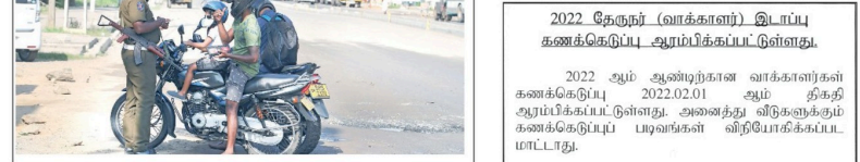
நட்டில் நேற்று அமுலுட்படுத்தப்பட்டிருந்த ஊரடங்கு சட்டத்தின்படி பிரதேச நகரங்கள் விடிகளே

2022 தேசியத் தேர்தல் (வாக்காளர்) இடப்பு கணக்கெடுப்பு ஆரம்பிக்கப்பட்டுள்ளது.