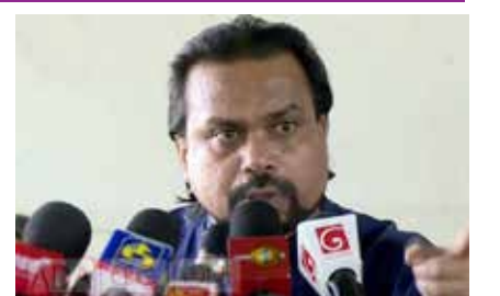
அரசாங்கத்தை ஏற்படுத்துமாறு, ஜனாதிபதியிடம் இன்று மீண்டும் தாங்கள் வலியுறுத்துகின்றனர் எனவும் அவர் தெரிவித்துள்ளார்.

அதிருப்தியில் உள்ளாகியுள்ள முழுநிர்வாகத்தையும் நீக்கிவிட்டு, இடைக்கால அரசாங்கத்தை அமைப்பதற்கான களத்தை அமைக்குமாறு விமல் வீரவன்ஸ எம்.பி. ஜனாதிபதியிடம்கோரிக்கை விடுத்துள்ளார். 11 அரசாங்க பங்காளிகளின் பிரதிநிதிகள் பங்குபற்றிய கூட்டத்தில் நேற்று உரையாற்றும் போதே அவர் இவ்வாறு தெரிவித்தார். கேவலமான ஆட்சியை அகற்றி, நாடாளுமன்றத்தில் பெரும்பான்மை பலத்துடன் இந்த நாட்டில் இடைக்கால