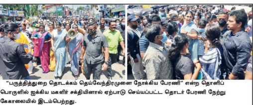
புகழியிலும் போராட்டம் இடம்பெறும் போது (04) ஆர்ப்பாட்டம் இடம்பெறப்பட்டது.