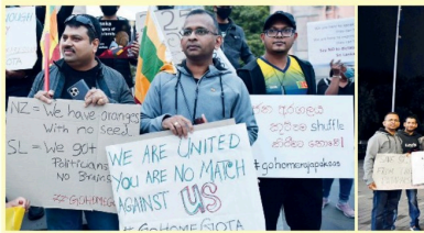
இலங்கை அரசாங்கத்திற்கு எதிர்ப்புத் தெரிவிக்கும் வகையில் நியூசிலாந்தில் வசிக்கும் இலங்கையினர்கள் கிரிஸ்லேன் நகரில் நேற்று (04) போராட்டம் முன்னெடுக்கப்பட்டது.

கண்டறிய வழங்குகின்ற உதவியை நாடியுள்ள பொலிஸார் மிரிஹாணையில் இடம்பெற்ற ஆர்ப்பாட்டத்தின்போது வன்முறைச் சம்பவம் தொடர்பில் இது குறிக்கோலாக வைக்கப்பட்ட பொலிஸார் போதுவரத்தினால் உதவிவை கோரியுள்ளனர். அண்மையில் மிரிஹாணை பொலிஸ் பிரிவிருந்தபட்சம் மட்டும் தொடர்பில் தெரிவிக்கப்பட்டுள்ள நிலையில், வன்முறையை தடுக்கும் வகையில் செயற்பாட்டில் பொது தொழிலாளர்களுக்கு தேவையான பஸ்களுக்கு, பஸ் மற்றும் ஏரைய வாகனங்களுக்கு தேவையான இச்சம்பவத்தின் தொடர்பில் ஆங்கில நபர்களை கைதுசெய்து கைதுசெய்துள்ளனர். அத்துமீறல்களை குறைப்பதற்காக இவர்களை கைதுசெய்துள்ளனர். அத்துமீறல்களை குறைப்பதற்காக இவர்களை கைதுசெய்துள்ளனர். அத்துமீறல்களை குறைப்பதற்காக இவர்களை கைதுசெய்துள்ளனர். அத்துமீறல்களை குறைப்பதற்காக இவர்களை கைதுசெய்துள்ளனர். அத்துமீறல்களை குறைப்பதற்காக இவர்களை கைதுசெய்துள்ளனர்.