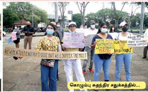
கொழும்பு சுதந்திர சதுக்கத்தில்...