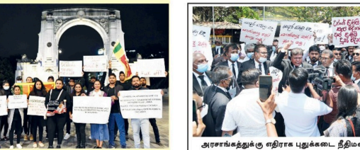
அரசாங்கத்திற்கு எதிராக புதுக்கடை தீர்மானம் வாகனத்தில் சட்டத்தாளிகளோடு நேற்று (04) போராட்டம் இடம்பெறப்பட்டது.