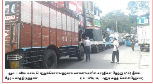
ஊட்டளில் டீசல் பெற்றுக்கொள்வதற்கான வரணங்களில் சாரதிகள் நேற்று (04) திட்ட நேரம் சாரதிருந்தனர்.

(ஏ.ஏ.எம்.பாஸில்) பவாங்கொடை நகரில் அமைந்துள்ள சட்டத்தரணிகள் ஆறு பேரின் காரியாலயங்களில் கைவசனில் பூட்டுகள் உடைக்கப்பட்டுள்ளன. நேற்று முன்தினம் இடம்பெற்றுள்ள இச்சம்பவங்கள் குறித்து பவாங்கொடை பொலீஸ் நிலையத்தில் முறைப்பாடுகள் செய்யப்பட்டதற்கிடையில் பொலீஸார் விசாரணைகளை மேற்கொண்டுள்ளனர். கானமல் போளே பொருட்கள் மற்றும் ஆணைகள் குறித்து தகவல்கள் இதுவரை வெளியிடப்படவில்லை. பொலீஸார் மேலதிக விசாரணைகளை மேற்கொண்டு வருகின்றனர். இதுவேளை பவாங்கொடை நகரம் மற்றும் கற்றுப்பற்ற பகுதிகளில் இரவு, பகல் வேளைகளில் திருட்டுச் சம்பவங்கள் இடம்பெற்று வருகின்றமை குறித்து முறைப்பாடுகள் செய்யப்பட்டுள்ளன. போளேத்து அபயமாளர்கள் இக்கொண்டைச் சம்பவங்களுடன் தொடர்புபட்டிருப்பதாக பிரதேச மக்கள் தெரிவிக்கின்றனர். பாதுகாப்புத் தர்ப்பள இவ்வியயத்தில் இறந்திட அதிக அக்கறை செலுத்துகோண்டு என பிரதேச மக்கள் வேண்டுகோள் விடுகின்றனர்.