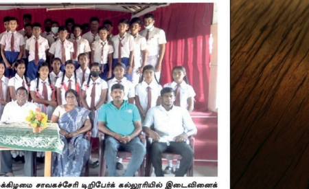
கன்னடம் பாரம்பரிய ரோட்டரிக் கழகத்தால் உடந்த விழாக்கிழமை சாவகச்சேரி டிபிரீக் கல்லூரியில் இடைவினைக் கழகம் அங்குராப்பணம் செய்துவைக்கப்பட்டது.

(ரவீன் ரஸ்மின்) திருகோணமலை கிண்ணியா பிரதேசத்தில் அரிய வகை சிறுத்தைப் பூனை யொன்று கிணற்றிலிருந்து மீட்கப்பட்டது. இது கிணற்றிலிருந்து மீட்கப்பட்டது. இது கிணற்றிலிருந்து மீட்கப்பட்டது. இது கிணற்றிலிருந்து மீட்கப்பட்டது.