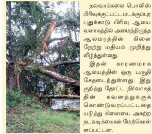
தவவாக்கலை பொலிஸ் பிரிவுக்குட்பட்ட மடக்கும்புரையில் ஆலமரக் கிளை முறிந்து வீழ்ந்தது.

தவவாக்கலை பொலிஸ் பிரிவுக்குட்பட்ட மடக்கும்புரையில் ஆலமரக் கிளை முறிந்து வீழ்ந்தது. இதன் காரணமாக ஆலமரத்தின் ஒரு பகுதி சேதமடைந்தது எனும். இது குறித்து தேசிய தீர்வாக்க திணைக்களம் முறிந்து வீழ்ந்தது.