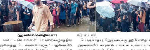
(ஹாலிஸ் செய்தியாளர்) ஊவா - வெயல்லை பல்வகைகளுக்கு எதிராக அனைத்து பட்ட மாணவர்களும் புகழையால் கொட்டும் மழையிலும் நேற்று ஆர்ப்பாட்டத்தில் ஈடுபட்டனர். பொருளாதார நெருக்கடிகளுக்கு தற்போதைய அரசாங்கமே காரணம் எனக் கட்டிக்கொடுக்கப்பட்டுள்ள அமைச்சர் ஜனாதிபதி கோட்டாபய உடையோகை