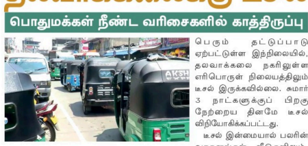
பொதுமக்கள் நீண்ட வரிசைகளில் காத்திருப்பு

பெரும் தட்டுப்பாடு ஏற்பட்டுள்ள இந்நிலையில், தலவாக்கலை நகரிலுள்ள எரிபொருள் நிலையத்திலும் டீசல் இடுக்கலிக்குப் பிற்பாடு நேரையில் தினமே டீசல் வழங்கப்படும் என தெரிவிக்கப்பட்டது. டீசல் இடமையால் பவரின் வாகனங்கள் எடுக்கப்படும். இதற்கிடையில் நேற்று காலை 20 விநாடிகளில் சார்திகள், நீண்ட வரிசையில் காத்திருந்தனர். இந்நேரத்தை, வாகனங்களும் நீண்ட வரிசையில் நிற்கின்றன. பாதுகாப்புக் கமிட்டி மொலிஸ்தும் ஈடுபடுத்தப்பட்டிருந்தனர்.