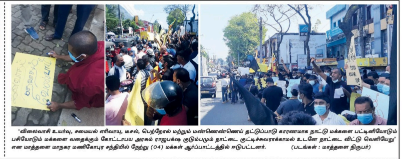
விலைவாசி உயர்வு, சமையல் எரிவாயு, டீசல், பெற்றோல் மற்றும் மண்ணெண்ணெய் தட்டுப்பாடு காரணமாக நாட்டு மக்களை பட்டினியோடு பரிபோடும் மக்களை வதைக்கும் கோட்டாபய அரசும் ராஜபக்ஷ குடும்பமும் நாட்டை குடும்பக் காரர்களால் உடனே நாட்டை விட்டு வெளியேறும் என மாதந்தனை மாதிரி மனிதரின் உயிர் தீர்மானம் (04) மக்கள் ஆர்ப்பாட்டத்தில் ஈடுபட்டனர்.