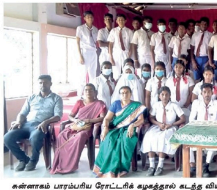
கன்னடம் பாரம்பரிய ரோட்டரிக் கழகத்தால் உடந்த விழாக்கிழமை சாவகச்சேரி டிபிரீக் கல்லூரியில் இடைவினைக் கழகம் அங்குராப்பணம் செய்துவைக்கப்பட்டது.

அரசாங்கத்தின் நடவடிக்கைகளுக்கு எதிர்ப்பு தெரிவிக்கும் வகையில் கண்டி நகர் எங்கும் நேற்று கறுப்புக் கொடிகள் பறக்கவிடப்பட்டன. சட்டத்தளனிகள் சங்கம் உள்ளிட்ட வந்தக சங்கங்கள் பல இன்னொன்று இதை எதிர்ப்பு நடவடிக்கையை முன்னெடுத்துள்ளன. நகரிலுள்ள அனைத்து வந்தக நிலையங்களிலும் இவ்வாறு கறுப்புக் கொடிகள் பறக்கவிடப்பட்டுள்ளன. கண்டி கட்டத்தளனிகள் சங்கம், சிங்கள வந்தக முன்னணி, முஸ்லிம் வந்தக சங்கம், தமிழ் வந்தக சங்கம், மத்திய மாணவ வளிக் மற்றும் தொழிற்சாலை சபை உள்ளிட்ட பல்வேறு சங்கங்கள் மற்றும் அமைப்புகள் இந்த எதிர்ப்பு நடவடிக்கைகளில் ஈடுபட்டுள்ளன.