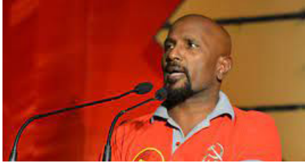
உடாகத் தீர்க்கப்பட வேண்டும்.

இந்த மக்களின் பிரச்சினைகள் தேசிய பேரவையின்