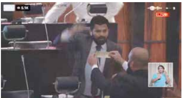
எம்.பிக்கள் இதன்போது சாணக்கியனுக்கு எதிர்ப்பை வெளியிட்டனர்.

அதன்போது அவர் முன் சென்ற சாணக்கியன் எம்.பி, ஜயாயிரம் ரூபா தானை நீட்டியபடி அதனைப் பெற்றுக்கொண்டு பேசுமாறு சைகை செய்தார். இதன்போது சபையில் களேபரம் ஏற்பட்டது. ஆளுங்கட்சி