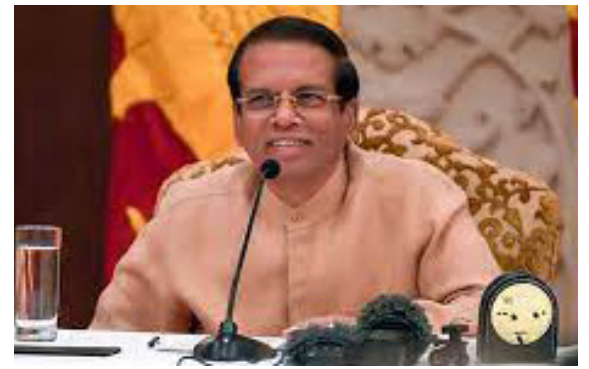
தலைமையிலான சுதந்திரக் கட்சி ஆதரவை வழங்கியிருந்தமை குறிப்பிடத்தக்கது.

வேண்டும் என்றும் அவர் கோரிக்கை விடுத்தார். மேலும் சுதந்திரக் கட்சியின் 14 நாடாளுமன்ற உறுப்பினர்களும் இனிமேல் அரசாங்கத்தை பிரதிநிதித்துவப் படுத்த மாட்டார்கள் என்றும் அவர் தெரிவித்துள்ளார். 20 ஆவது திருத்தத்துக்கு மைத்திரிபால சிறிசேன