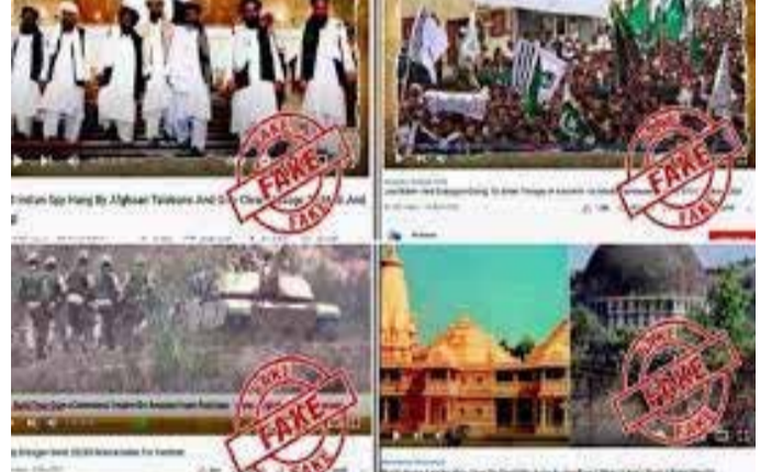
காரங்களைப் பயன்படுத்தி இத்தகைய தடை நடவடிக்கைகள் எடுக்கப்பட்டு வருகின்றமை குறிப்பிடத்தக்கது.

இந்திய இறையாண்மை மற்றும் ஒருமைப்பாட்டுக்கு எதிராக செயல்பட்டு வருகின்றன என்ற குற்றச்சாட்டின் அடிப்படையில் மேலும் 22 யூடியூப் சனல்களை இந்தியத் தகவல் ஒளிபரப்புத் துறை அமைச்சகம் முடக்கியுள்ளது. இதில் 18 இந்திய யூடியூப் சனல்கள் மற்றும் பாகிஸ்தானைச் சேர்ந்த 4 யூடியூப் சனல்கள் இவ்வாறு முடக்கப்பட்டுள்ளன. பிரதமர் நரேந்திர மோடி தலைமையில் மத்தியில் பா.ஜ.க. அரசு பொறுப்பேற்ற பின்னர், தகவல் தொழில்நுட்ப சட்ட வழிகாட்டுதல் மற்றும் டிஜிற்றல் மீடியா நெறிமுறைகளின் கீழ் அவசரகால அதி