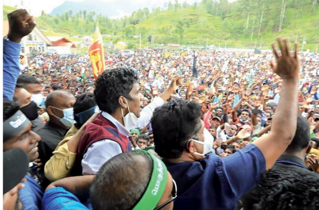
தமிழ் முற்போக்கு கூட்டணியின் ஏற்பாட்டில் அரசுக்கு எதிரான போராட்டம் தல்வாக்கலை நகர விளையாட்டு மைதானத்தில் நேற்று (07) இடம்பெற்றது.