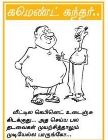
வீட்டில் வெயிலை உடைக்கக் கூடாது... அது செய்ய பல தடவைகள் முயற்சித்தாலும் முடியவில்லை பாராட்டுகோ...

தூத்துக்குடியைச் சேர்ந்த யாசகர் பூப்பண்டியடன், தான் யாசகப் பெற்று 20 ஆயிரம் ரூபாயை இலங்கை பெற்று 82 ஆயிரம் ரூபா) பொருளாதார நிதி நெருக்கடியில் சிக்கியுள்ள இலங்கை அரசுக்கு வழங்கியதாக அறிவித்துள்ளார்... 02 பக்கம்