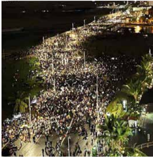
கியிருந்தனர் என்று ஆர்ப்பாட்டக்களத்திலிருந்து கிடைத்த தகவல்கள் தெரிவித்தன. (அ)

இவர்களின் இறை வழிபாட்டு நிகழ்வுகளுக்கு தமிழ், சிங்கள மக்களும் பூரண ஒத்துழைப்பை வழங்