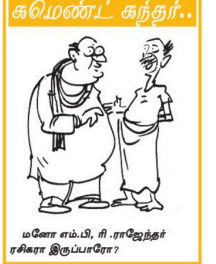
மனோ எம்.பி. ராஜபக்ஷ ரகிரா இப்போது? 02 பக்கம்

அலிமுக்கத்தில் மற்றும் ஜனாதிபதி செயலக முன்னிலை உட்கர் இரண்டு நாட்களாக பல்வேறு தரப்பினராலும் இணைந்து முன்னெடுக்கப்பட்டு வரும் ஆர்ப்பாட்டம் நேற்று முன்தராவது நாளாகவும் தொடர்ந்தவண்ணம் உள்ளது. கூந்த பல மாதமாக அலிமுக்கத்தில் பகுதியில் ஆர்ப்பாட்டங்கள் நேற்கொள் வதற்கு ஆர்ப்பாட்ட இடம் என பெயர்ப்பலகை காட்சிப்படுத்தப்பட்டிருந்தது. இந்நிலையில், தற்போது ஆர்ப்பாட்டக் காரர்களால் காலிமுக் ஆர்ப்பாட்டத்தின் அந்த இடத்திற்கு 'கோட்டாக்கோகாம' என்று பெயரிடப்பட்டதுடன், அவர்கள் அங்கே கூடுதல் மெட்டிலும் இணைந்துள்ளனர்.