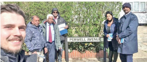
(வடலியா திருபு) பிரித்தானியாவின் பழமைவாதக் கட்சி எம்.பி. உள்ளூர் மாநகரசபைத் தேர்தலில் 6 தமிழர்கள் போட்டியிடுகிறார்கள். அவர்களுக்கு சார்பான தேர்தல் பரப்புரை நடவடிக்கைகள் தமிழ் செயற்பாட்டாளர்களால் முன்னெடுக்கப்பட்டு வருகின்றது.

வண்னின் ரெய்னால்ட் வேன் நிவையத்திற்கு முன்னால் ஆரம்பிக்கப்பட்ட குறித்த தேர்தல் பரப்புரையானது, பல்வேறு பகுதிகளிலும் முன்னெடுக்கப்பட்டது. இதில் புலம்பெயர் செயற்பாட்டாளர்கள் பலரும் கலந்து கொண்டனர்.