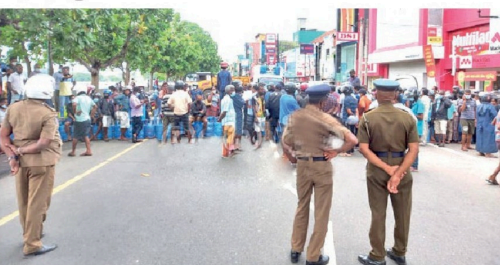
எரிபொருளை விரைவாக பெற்றுக்கொடுக்க கோரி மாத்தறை - கொழும்பு வீதியை மறித்து காலி சமுத்திர வீதியின் இடையில் நேற்று மக்கள் ஆர்ப்பாட்டத்தில் ஈடுபட்டனர். வீதியில் போக்குவரத்துக்கு சும்பாதிப்பு ஏற்பட்டிருந்தது. எரிபொருளை பெற்றுக்கொள்வதற்காக நேற்று முன்தினம் இரவு எரிபொருள் கிடைக்காமையினால் அங்கிருந்த சிலரே நாடாளுமன்ற உறுப்பினர்கள் மண்டலியூட்ட இவ்வாறு ஆர்ப்பாட்டத்தில் ஈடுபட்டுள்ளனர். இதன் காரணமாக அந்த வீதியினூடாக பயணிக்கும் வாகனங்கள் மாற்று வீதியை பயன்படுத்த நடவடிக்கை எடுக்கப்பட்டிருந்தது.