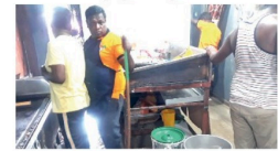
(தலவாக்கலை திருபு) நுவலெரிவாயு பதிக் கடை, வீதியில் அலைந்துள்ள உணவகமொன்றில் நேற்று (11) தீப்பரவல் ஏற்பட்டுள்ளது. இந்தச் சம்பவம் தொடர்பில் மேலும் தெரியவரவில்லை. இந்த சம்பவம் நேற்று மதியில் இடம்பெற்றது. எது. சமையல் எரிவாயு சிலிண்டரில் ஏற்பட்ட கசிவினால் இந்த தீப்பரவல் சம்பவம் இடம்பெற்றது. தீ ஏற்பட்டதையடுத்து, சம்பவ இடத்துக்கு விரைந்து வந்த நுவலெரிவாயு மாநகரசபை தலைமைப் படைமீள்ையை உட்பெயர்ந்துகொண்டு வந்தனர். இந்த தீவிபத்தில் பாரிய சேதம் ஏதும் ஏற்படவில்லை. பகுதியாளிகளே பொருட்கள் சேகரிக்கப்பட்டுள்ளதாக உணவக ஊழியர்கள் தெரிவித்துள்ளனர்.