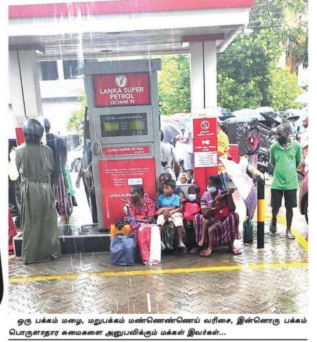
ஒரு பக்கம் மழை, மறுபக்கம் மண்ணெண்ணெய் வரிசை, இன்னொரு பக்கம் பொருளாதார சமூகத்தை அனுபவிக்கும் மக்கள் இவர்கள்... 02 பக்கம்