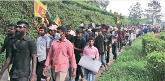
பிரச்சினைகளை கண்டித்து சென்னை மல் தோட்ட இளைஞர் யுவதிகள் இந்த ஆர்ப்பாட்டத்தை முன்னெடுத்திருந்தனர். சென்னை மல் தோட்ட காரியாலயத்திற்கு அருகாமையில் ஆரம்பமான இடப்பேரணி மட்டுக்கலை சந்தி வரை பேரணியாக சென்று அரசுக்கு எதிரான ஆர்ப்பாட்டத்தில் ஈடுபட்டனர்.