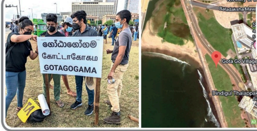
தோட்டாக்கோகாம கோட்டாக்கோகாம GOTAGOGAMA