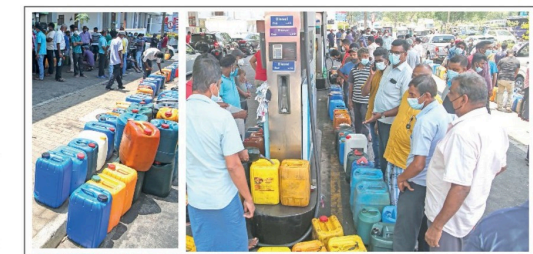
கொழும்பிலுள்ள எரி பொருள் திறப்பு நிலைய மொன்றில், எரிபொருள் பெற்றுக்கொள்வதற்காக நேற்று (11) மக்கள் காத்திருந்தனர்.

வண்னின் ரெய்னால்ட் வேன் நிவையத்திற்கு முன்னால் ஆரம்பிக்கப்பட்ட குறித்த தேர்தல் பரப்புரையானது, பல்வேறு பகுதிகளிலும் முன்னெடுக்கப்பட்டது. இதில் புலம்பெயர் செயற்பாட்டாளர்கள் பலரும் கலந்து கொண்டனர்.