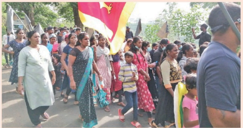
(தலவாக்கலை திருபு) விந்துவை, சென்னை மல் தோட்ட இளைஞர், யுவதிகள் அரசுக்கு எதிராகவும் நேற்று (11) ஆர்ப்பாட்டத்தில் ஈடுபட்டனர்.