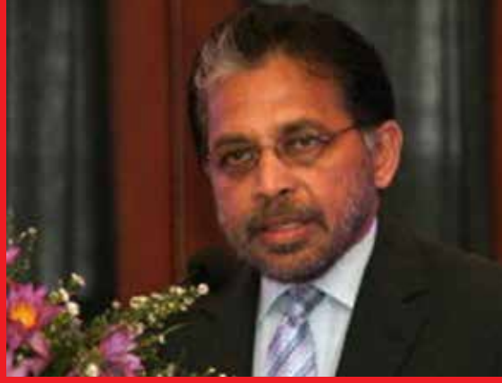
இதேவேளை, சீனாவிடம் இருந்து கடன் உதவியைப் பெற்றுக்கொள்வதற்காக ஜனாதிபதி கோட்டா பய ராஜபக்ஷ, அண்மையில் சீன அதிபர் ஜி ஜின்பிங் கிற்கு கடிதம் எழுதியிருந்தமை குறிப்பிடத்தக்கது.

அத்துடன் ஆடை ஏற்றுமதித் தொழிலுக்குத் தேவையான பொருள்களை 150 கோடி டொலர் கடன் வரியில் கொள்வனவு செய்யமுடியும் எனக் குறிப்பிட்டுள்ளார்.