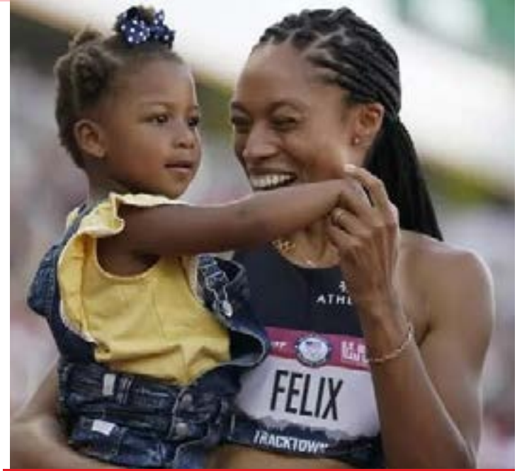
ஒலிம்பிக்ஸில் 11 பதக்கம் வென்ற அமெரிக்க வீராங்கனை

யாசத்தில் குஜராத் அணி வெற்றி பெற்றது. இந்த வெற்றியால் குஜராத் அணி 4 வெற்றிகளுடன் புள்ளிப் பட்டியலில் முதல் இடத்தைப் பிடித்துள்ளது. கொல்கத்தா அணி இரண்டாவது இடத்திலும், ராஜஸ்தான் அணி மூன்றாவது, பஞ்சாப் அணி நான்காவது இடங்களிலும் உள்ளன.