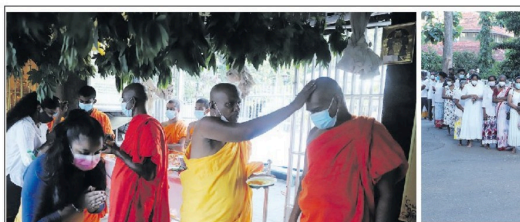
தமிழ், சிங்கள புத்தாண்டை முன்னிட்டு எண்ணெய் தேய்க்கும் திசுவ நேற்று (17) கோட்டை இராம விளையலில் இடம்பெற்றது.

விளைந்த பொருள்மிக நெருக்கடி தற்போது தமிழர்களையும் கடுமையாக பாதிக்கின்றது. நமக்குரிய சுயநினைவு உரிமையை, தன்னாட்சியை, உலகம் அங்கீகரிக்க வேண்டிய சலுகை இது. சிங்கள ஆட்சியாளர்களின் தவறான முடிவுகளால் தமிழர்களுக்கும் அழிந்துபோவதை ஏற்க முடியாது. புலம்பெயர் உறவுகளுக்கும், எம்மக்கு ஆசுவான சர்வதேச ஆற்றல்களுக்கும் நேற்று தமிழர்கள் எம்மால், மம்மம் வலுவான திறன் வாய்ந்த சக்தியாக நிறுவ முடியும் - எனத் தெரிவித்தார்.