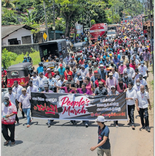
நாட்டில் 74 வருட சாக்கேட்டுக்கு முற்றுப்புள்ளி வைப்போம் எனும் தொனிப்பொருளில் மக்கள் விடுதலை முன்னணியினால் ஏற்பாடு செய்யப்பட்ட பேரணி பேருலையை மீ நேற்று ஆரம்பமானது. பெருந்திரளான மக்கள் அதில் கலந்துகொண்டிருந்தனர்.