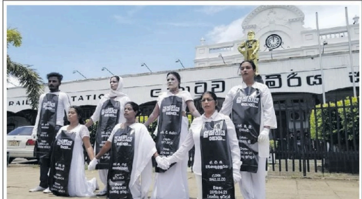
உயிர்த்த குராமிய தின தாக்குதல் இடம்பெற்று மூன்று வருட ஸ்திரீயாகின்ற நிலையில், பாதிக்கப்பட்ட மக்களுக்கு நீதி கோரி கொழும்பின் பல்வேறு பிரதேசங்களில் நூதன முறையில் ஆர்ப்பாட்டமொன்று நேற்று (17) முன்னெடுக்கப்பட்டது.

பெறுபுக்கூறும் கட்டப்பாட்டையே மக்களின் பேராட்டங்களின் முக்கிய கவனத்திற்குரியவையாக இருக்கின்றன. அன்றாடம் வலுப்பெற்று வருகின்ற மக்களின் அக்ஷேபங்களுக்கு செவிமீட்டு நம்பகத்தன்மையும் கண்ணியத்தையும் மீட நினைவிறுத்துமாறு குறிப்பாக, அரசாங்கத்தின் தலைமைத்துவத்தை நாம் கோருகிறோம். தற்போது மக்களால் வெளிப்படுத்தப்பட்டுகின்ற கோரிக்கைகளின் உணர்வுகளை நாம் ஏற்றுக்கொள்கிறோம். அதனால், ஜனாதிபதி பதவியிடம் மீதமிடும் அபிமானங்களைக் குவிக்கின்றதும் பொறுப்புக்கூறும் கட்டப்பாட்டையும் வெளிப்படுத்தின்றமையும் உறுதிப்படுத்தி அரசாங்கத்திற்கும் எதிரணிக்கும் ஏற்புடைய புதிய பிரதமரின் கீழான ஓர் இடைக்கால அரசாங்கம் ஒன்று இன்றைய அவசரத்தேவையாகும். புதிய முகங்களுடனான அத்தகைய இடைக்கால அரசாங்கம் ஒன்றான பொருளாதாரத்தை முட்டிவிடாமல் இருந்து எழுப்பிவிட்ட தேவையான குறுகியகால நிதிமீதக்கு சர்வதேச சமூகத்திடம் வேண்டுகோளை விடுக்கக்கூடியதாக இருக்கும். எப்போதும், எமமை எரிவாயு, மின்சாரம், மருத்துவ வகைகள் மற்றும் அபிவிருத்தியை பாதுகாப்பதற்கான பொதுமக்களுக்கு விநியோகப்படுத்தும் உடனடிச் சலுகைகள் செலுத்தப்படவேண்டும் எனத் தெரிவிக்கப்பட்டுள்ளது.