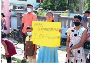
கல்முனை இருதரநாள் ஆலயத்தின் முன்னால் மக்கள் உயிர்த் தூயிறு தாக்குதலுக்கு இதுவரை நதி கிடைக்கவில்லை எனவும் உடனடியாக விசாரணை மேற்கொள்ளப்பட வேண்டும் எனவும் கவனநீர்ப்பு போராட்டம் ஒன்றினை நேற்று மேற்கொண்டனர்.