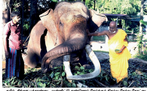
தமிழ், சிங்கள புத்தாண்டை முன்னிட்டு எண்ணெய் தேய்க்கும் நிகழ்வு நேற்று கோட்டை ஜமகா விசாலையில் இடம்பெற்றது.