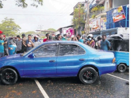
24 மணித்தியாலங்களுக்குள் எரிபொருள் பெற்றதுக்கு பொலீஸார் உறுதியளித்ததைப்பற்றி போராட்டம் நடத்தப்பட்டது.

அதன் பின்னர் அவ்விடத்துக்கு வந்து போலீஸார் போராட்டக்காரர்களுடன் பேச்சுவார்த்தை நடத்தினர். மொனராகலையில்