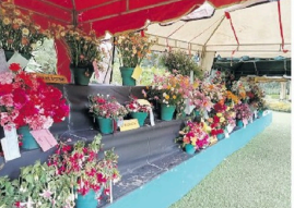
கண்காட்சியில் நுவரெலியா மாநகர சபையின் முதல்வரின் தலைமையில் நேற்று நுவரெலியா மாவட்ட சபையினர் கலந்துகொண்டனர்.

இந்நிழுவில் வெற்றி கண்டவர்களுக்கு பண்பாட்டிற்காகவும், சான்றிதழ்களையும் வழங்க ஏற்பாடு செய்யப்பட்டுள்ளது. நுவரெலியா நகர சபையின் ஏற்பாட்டில் ஒழுங்கு நடவடிக்கைகள் இந்த மலர் கண்காட்சியில் நுவரெலியா மாநகர சபையின் முதல்வரின் தலைமையில் நேற்று நுவரெலியா மாவட்ட சபையினர் கலந்துகொண்டனர்.