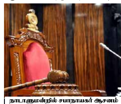
நாடாளுமன்றில் சபாநாயகர் ஆசனம்

சபாநாயகருக்கு உரித்தான அனைத்து அதிகாரங்கள் மற்றும் செயற்பாடுகள் தொடர்பாக சபாநாயகருக்கு மற்றும் சபாநாயகரினூடாக சபைக்கும் ஆலோசகராக செயலாளர் நாயகம் இருக்கின்றார். அவர் சபாநாயகரின் அதிகாரத்துக்குக் கீழும் சபாநாயகரின் சார்பிலும் கடமையாற்றுகின்றார். சபாநாயகரும் செயலாளர் நாயகமும் நெருக்கமாக கூட்டு வைத்திருப்பதுடன் ஒருவர் மற்றொருவர் மேல் பரிபூரண நம்பிக்கையுள்ள உறவைக் கொண்டிருப்பார்.