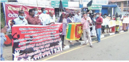
(ச.கி.ஷந்தன்) ஜனாதிபதி மற்றும் தற்போதைய அரசாங்கத்தைப் பதவி விலகுமாறு கோரி கொழும்பு காலிமுத்தலில்

தெரிவிக்கவும், வலுசேர்க்கவும் இரண்டாவது நாளான நேற்றும் (18) ஹட்டன் மலையிப்பு சுத்தியில் போராட்டம் தொடர்ந்து முன்னெடுக்கப்பட்டது. ஜனநாயகத்துக்கான மக்கள் குரலானும் தொடர்புபொருள்களும் சமூக செயற்பாட்டாளர்கள் மற்றும் இளைஞர்கள் இணைந்து நேற்று முன்தினம் (17) இந்தப் போராட்டத்தை ஆரம்பித்தனர். இந்நிலையில், இன்றைய போராட்டத்தில் கோ கோட்டா ஹோம், மலையக மக்களுக்கு விடிவு கிடைக்க வேண்டும், தமிழ் பேசும் மக்களின் பிரச்சினைகளை தீர்ப்பதற்கு ஆளுமை உள்ள அரசாங்கம் உருவாக வேண்டும், நாடாளுமன்ற உறுப்பினர்கள் மனசாட்சியோடு நடந்துகொள்ள வேண்டும், விலை குறை, அடுத்த தலைமுறை வலுவான வேண்டும் போன்ற வாகனங்கள் எழுப்பிய சலுகை அட்டைகளை எஃகிப்படுத்தினார், அதோடு, கறுப்புக் கொடியை எதிரியிருத்ததோடு, கோஷங்களை எழுப்பியிருந்தனர். பொலிஸாரின் பதறுகாப்பு பலப்படுத்தப்பட்டிருந்தது. இந்தப் போராட்டத்தின்போது ஹட்டன் மலையிப்பு சுத்தியில் GO GOTTA HOME கிளாக்கித் தினை அங்குரப்பணம் செய்துவைக்கப்பட்டமை குறிப்பிடத்தக்கது.