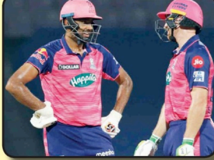
அஷ்வின் - பட்லர்

அந்த நிலையில் 2011ஆம் ஹர்பஜன் சிங்க இடம்பெற்றிருந்த மும்பை இந்தியன்ஸ், ஆண்டிரூ சமைன்சை வாஸ்கியு அனைவரையும் ஆசிரியத்தில் ஆழ்த்தியது. அதன்பின் நாட்டுக்கான விளையாடியபோது போட்டுக்கொண்ட சன்னை மறந்த இந்த ஜோடி ஒன்றாக ஒரே அணியில் விளையாடியதைப் பார்க்க