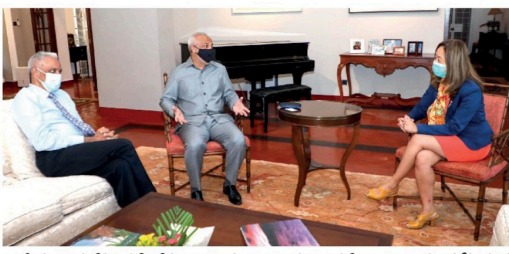
ஸ்ரீலங்கா முல்லைம் காங்கிரஸின் தலைவரும் நாடாளுமன்ற உறுப்பினரான ரஜப் ஹக்கீம் மற்றும் இலங்கைக்கான அமெரிக்க தூதுவர் ஜூலியா சம் ஆகியோருக்கும் இடையிலான சந்திப்பு அமெரிக்க தாதரத்தில் நேற்று இடம்பெற்றது. பொருளாதார நெருக்கடிக்கான அரசியல் மறுசீரமைப்பு மற்றும் சிறுபான்மையினர் எதிர்நோக்கியுள்ள பிரச்சினைகள் குறித்து இதன்போது விரிவாக ஆராயப்பட்டது.

நமது வி.செ.செய்தியாளர் நாட்டில் கடந்த 17 நாட்களில் வீதி விபத்துகள் காரணமாக 128 பேர் உயிரிழந்துள்ளதாக பொலிஸ் தலைமையகம் தெரிவித்துள்ளது. இவ்வாறு மூலமாக திகழ்ந்த 17ஆம் திகழ் விபதான நாட்டிலேயே இவ்வாறு 128 பேர் உயிரிழந்துள்ளனர். இந்தக் காலப்பகுதியில் 121 விபத்துகள் இடம்பெற்றுள்ளதாக பொலிஸ் தலைமையகம் மேலும் குறிப்பிட்டுள்ளது. முச்சக்கரவண்டி மற்றும் மோட்டார்சைக்கிள்களே அதிகம் விபத்துக்குள்ளாகியுள்ளன. அதில் பயணித்தோரே அதிக எண்ணிக்கையில் பலியாகியுள்ளனர். இதேவேளை, பண்டிகை காலத்தில் நூற்று நாட்களில் மாதிரியும் பம்பேறு விபத்துகளில் பாதிக்கப்பட்ட 854 பேர் கொடும்பு தேசிய வைத்தியசாலையில் சேர்க்கப்பட்டுள்ளனர். இம்மாதம் 11ஆம் திகழ் முதல் 15ஆம் திகழ் வரையான காலப்பகுதியில் விபத்துக்குள்ளானோரே சேர்க்கப்பட்டுள்ளனர். இவ்வாறு அனுமதிக்கப்பட்டோரில் 430 பேர் தொடர்ந்தும் சிகிச்சைப்பெற்று வருகின்றனர். மேலும், கடந்த ஆண்டுள்ள ஒப்பீடுகளில், இந்த எண்ணிக்கை குன்று வீதத்தால் குறைவாகும் என வைத்தியசாலை தலைவர்கள் தெரிவித்தனர். அத்துடன், பட்டாக வெடித்ததன் காரணமாக இருவர் மரத்திரமே தேசிய வைத்தியசாலையில் சேர்க்கப்பட்டுள்ளமை குறிப்பிடத்தக்கது.