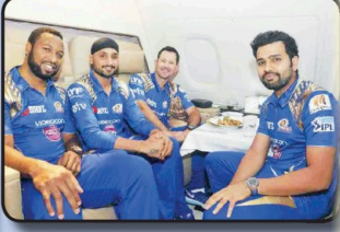
ஹர்பஜன் - பெரேட்டிய

முடியும் என ரசிகர்கள் கனவினும் கூட நினைத்திருக்க மாட்டார்கள்.