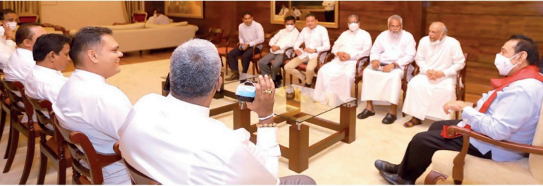
புதிதாக நியமிக்கப்பட்டுள்ள அமைச்சரவை அமைச்சர்கள் தமது நியமனக் கடிதங்களை பெற்றுக்கொண்டதன் பின்னர், பிரதமர் மஹிந்த ராஜபக்ஷவை நேற்று (18) அலரி மாளிகையில் வைத்து சந்தித்தனர்.