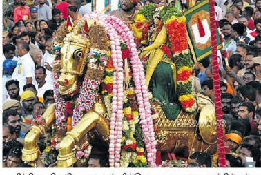
சித்திரை திருவிழாவை முன்னிட்டு, மதுரை வகை ஆற்றில் பகலாட்சி உடுத்தி எழுந்தருளியுள்ள காணிகள்...