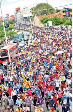
அரசாங்கத்துக்கு எதிராக 74 வருட சாக்கேட்டுக்கு முற்றுப்புள்ளி வைப்போம் என்ற தொடர்பொருளில் மக்கள் விடுதலை முன்னணியினால் முன்செய்துக்கொள்ளும் மாபெரும் மக்கள் பேரணி இன்று (19) கொழும்பை வந்தடையவுள்ளது. இந்தப் பேரணி நேற்று முன்தினம் (17) பேருவளை நகரிலிருந்து

ஆரம்பமாகியிருந்தது. இரண்டாம் நாளான நேற்று (18) வாதுவ பிரதேசத்திலிருந்து இந்தப் பேரணி ஆரம்பித்தது. இந்நிலையில், இன்றைய தினம் மொரட்டுவைய நகரிலிருந்து கொழும்பை வந்தடையவுள்ளதாக மக்கள் விடுதலை முன்னணி அறிவித்துள்ளது. நேற்றைய பேரணி பாணத்துறை பிரதேசத்தை வந்தடைந்தபோது பெருந்திரளான மக்கள் கலந்துகொண்டிருந்ததை அவதானிக்கக்கூடியதாக இருந்தது. இந்த அரசாங்கத்தை பதவியிலிருந்து நீக்க மக்கள் ஆட்சியொன்றை உருவாக்கவேண்டும் என்பதே இந்த மூன்றுநாள் தொடர் பேரணியின் எதிர்ப்பாப்பு என்றும், இன்றைய தினம் கொழும்பு வட்டின் சுற்று வட்டாரத்தை வந்தடையும் எனவும் கூறி அறிவித்துள்ளது.