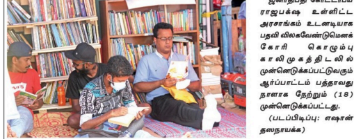
ஜனாதிபதி கோட்டாபய ராஜபக்ஷ உள்ளிட்ட அரசாங்கம் உடனடியாக பதவி விலகவேண்டுமெனக் கோரி கொழும்பு காலி முகத்திலில் முன்னெடுக்கப்பட்டுவரும் ஆர்ப்பாட்டம் பத்தரவது நாளாக நேற்று (18) முன்னெடுக்கப்பட்டது.