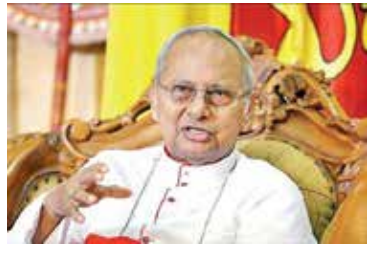
அழகிய தாய் நாடு சீரழிந்துவிட்டது என்றும் அவர் கவலை வெளி

நாட்டில் தற்போது ஊழல் நிறைந்த யுகம் தோற்றம் பெற்றுள்ளது எனவும் இதன் காரணமாக இனிமேலும் எவர் மீதும் நம்பிக்கை கொள்ள முடியாது என்றும் பேராயர் கர்தினால் மெல்கம் ரஞ்சித் ஆண்டகை தெரிவித்தார். அதிகாரத்தில் உள்ளவர்கள் மாத்திரமின்றி, அதிகாரம் அற்றவர்கள் கூட ஊழல்வாதிகளாக காணப்படுவதால் 74 ஆண்டுகளுக்குள்