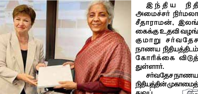
இந்திய நிதி அமைச்சர் நிர்மலா சீதாராமன், இலங்கைக்கு உதவி வழங்குமாறு சர்வதேச நாணய நிதியத்திடம் கோரிக்கை விடுத்துள்ளார். சர்வதேச நாணய நிதியத்தின் முகாமைத்துவப்

சர்வதேச நாணய நிதியத்திடம் இந்தியா நேரில் வலியுறுத்தல்