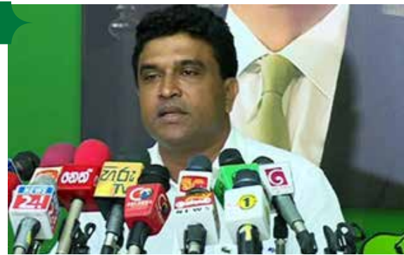
டொலர்களை வழங்கியமை மனித கொலைக்கு ஒப்பான விடயம் என்று அவர் குறிப்பிட்டுள்ளார்.

நாட்டில் இன்று பொதுமக்களுக்கு மருந்துகள் இல்லாத நிலையில் அரசாங்கம் தமது அதிகாரத்தை தக்கவைத்துக்கொள்ள ஓர் உறுப்பினருக்கு 20 லட்சம்