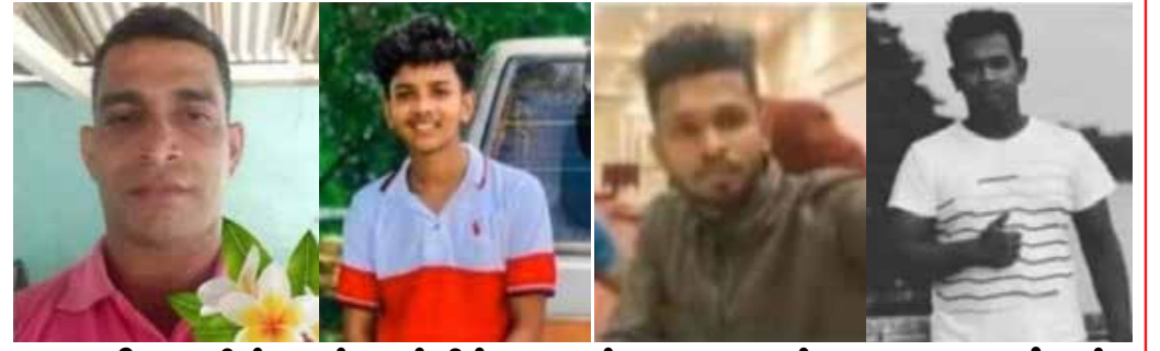
யொலிஸாரின் துப்பாக்கிச்சூட்டில் சாவடைந்த இளைஞர்கள்

கேகாலை மாவட்டம், ரம்புக்கனையில் போராட்டக்காரர்கள் மீது யொலிஸார் மேற்கொண்ட துப்பாக்கிப் பிரயோகத்தில் நால்வர் உயிரிழந்துள்ளனர். அத்துடன், இந்தச் சம்பவத்தில் காயமடைந்த 24 பேர் கேகாலை வைத்தியசாலையில் சேர்க்கப்பட்டுள்ளனர். காயமடைந்தவர்களில் 8 பேர் மக்களின் கல்வீச்சுத் தாக்குதலுக்குள்ளான யொலிஸ் அதிகாரிகள் என்று யொலிஸ் பேச்சாளர் தெரிவித்துள்ளார்.