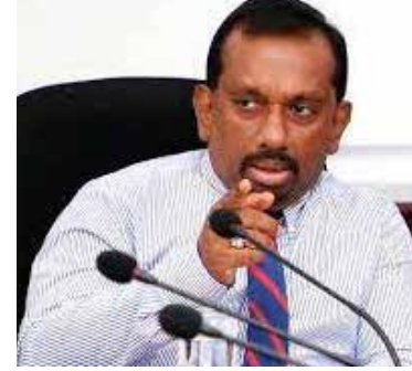
மையை 225 பேரும் இணைந்தே தீர்க்கவேண்டும் என்று அவர் கோரிக்கை விடுத்துள்ளார்.

உயிர்த்த ஞாயிறுத் தாக்குதல்கள் தொடர்பாக மன்னிப்பை கோர முன்னைய அரசாங்கத்துக்கு முதுகெலும்பு இருக்கவில்லை என்று அவர் தெரிவித்துள்ளார். இதன்போது விவசாயிகளுக்கு நட்டஈடுகளை வழங்க அரசாங்கம் நடவடிக்கை எடுத்து வருவதாகவும் மஹிந்தானந்த அளுத்தமகே நாடாளுமன்றத்தில் உரையாற்றும் போது குறிப்பிட்டுள்ளார். நாட்டில் இன்று ஏற்பட்ட நிலை