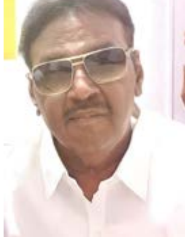
ஞானி இளையராஜா ஆகியோர் சாதாரண குடும்பத்தில் பிறந்து,

கடந்த சில தினங்களுக்கு முன்பு பிரபல இசையமைப்பாளர் இளையராஜா, பிரதமர் நரேந்திர மோடியை அம்பேத்கருடன் ஒப்பிட்டு வெளியான புத்தகம் ஒன்றிற்கு எழுதிய முன்னுரையில் தனது கருத்தைச் சொல்லியிருந்தார். அவரது கருத்துக்கு எதிர்ப்பும் மற்றொரு தரப்பினர் ஆதரவும் தெரிவித்து வருகின்றன. இந்த விடயம் தொடர்பாக தே.மு.தி.க. நிறுவனத்தலைவர் விஜயகாந்த் அறிக்கையொன்றினை வெளியிட்டுள்ளார். அண்ணல் அம்பேத்கர், பிரதமர் நரேந்திர மோடி, இசை