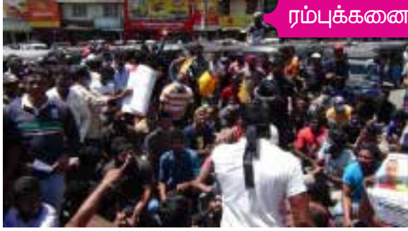
இதன்போது ரம்புக்கனையில் போராட்டக்காரர்கள் மீது பொலிஸார் மேற்கொண்ட தாக்குதலுக்கும் கடும் கண்டனக் கணைகள் தொடுக்கப்பட்டன. அரசு பயங்கரவாதம் மூலம் போராட்டத்தை ஒடுக்க முடியாது என மக்கள் கோஷங்களை எழுப்பினர்.