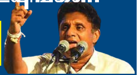
களையும் காக்க வேண்டிய பொறுப்பு பாதுகாப்புத் தரப்பினருக்கு இருக்கின்றது - என்றார்.

ரம்புக்கனை சம்பவத்துக்கு சபையில் சஜித் கண்டனம்