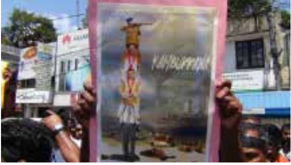
ஜனாதிபதி கோட்டாபய ராஜபக்ஷவும், பிரதமர் மஹிந்த ராஜபக்ஷ உள்ளடங்கலான அரசும் பதவி விலக வேண்டும் என வலியுறுத்தி நாட்டின் பல பாகங்களில் நேற்றும் போராட்டங்கள் முன்னெடுக்கப்பட்டன.