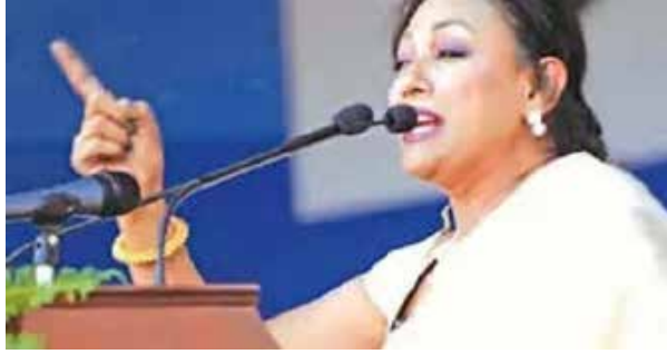
டம். காலி முகத்திடலில் உள்ள இளைஞர்களை சிலர், விற்று பிழைக்கின்றனர் எனவும் அவர் குறிப்பிட்டுள்ளார்.

காலம் வரும்போது ஜனாதிபதி நிச்சயம் செல்வார். அவர் வீடு செல்ல வேண்டுமா என்பதை தேர்தல் தீர்மானிக்க