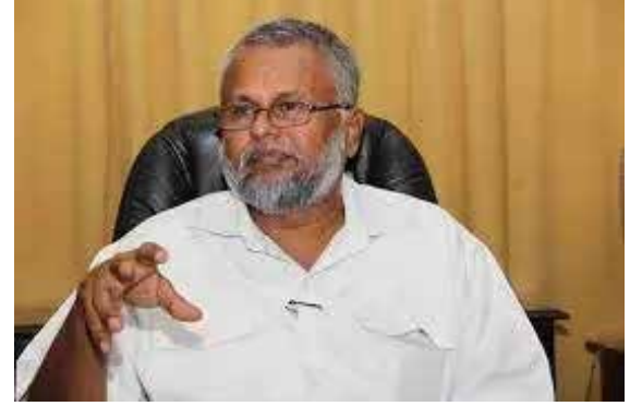
13 ஆவது திருத்தச் சட்டத்தை முழுமையாக அமுல்படுத்துவதில் ஆரம்பித்து படிப்படியாக தமிழ் மக்களின் அபிலாஷைகளை நோக்கிப் பயணிக்க வேண்டும் என்பதைக் கடந்த 35 வருடங்களுக்கும் மேலாக ஈ.பி.டி.பி. கட்சி வலியுறுத்தி வருகின்றமை குறிப்பிடத்தக்கது.

இந்நிலையில், ஈ. பி.டி.பி. ஆகிய எம்மைப் பொறுத்த வரையில், அரசமைப்பில் எவ்வாறான மாற்றங்கள் ஏற்படுத்தப்படும், தற்போதைய அரசமைப்பின் 13 ஆவது திருத்தச் சட்டத்தில் உள்ளடக்கப்பட்டுள்ள அதிகாரப் பரிசீலனை தொடர்பான விடயங்கள் முழுமையாக உள்ளடக்கப்பட வேண்டும் என்ற நிலைப்பாட்டில் உறுதியாக இருக்கின்றோம். - என்று தெரிவித்துள்ளார்.