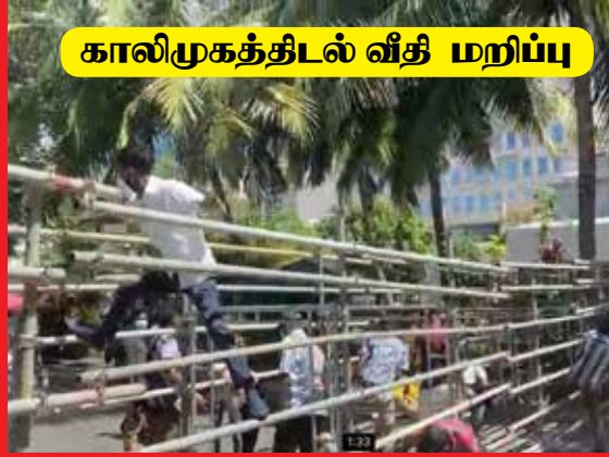
காலிமுகத்திடல் வீதி மறிப்பு