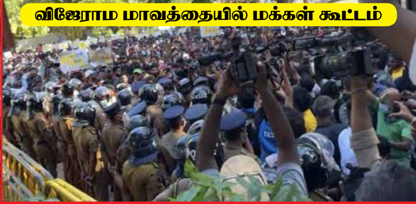
விஜேராம மாவத்தையில் மக்கள் கூட்டம்

கொழும்பு கோட்டையிலிருந்து பெரும் ஆர்ப்பாட்டப் பேரணியை ஆரம்பித்த பல்கலைக்கழகங்களுக்கு இடையிலான மாணவர்கள் சமூகத்தின் அணி காலிமுகத்திடலில் செல்வதற்கான பாதைகள் அடைபிடிக்கப்படும் மூடப்பட்ட நிலையில் பிரதமர் மஹிந்த ராஜபக்ஷின் இல்லம் அமைந்துள்ள விஜேராம மாவத்தையை நோக்கி பெருந்த எடுப்பில் ஊர்வலமாகச் சென்று அங்கு திரண்டு ஆர்ப்பாட்டம் நடத்தி வருகிறார்கள்.