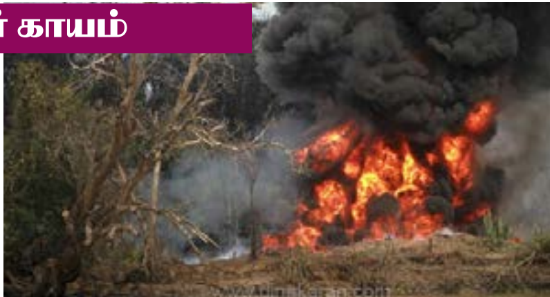
இடையேயான எல்லைப் பகுதியான எக்பெமா உள்ளூர் பகுதியில் உள்ள சட்டவிரோத எண்ணெய் சுத்திகரிப்பு

நைஜீரியாவில் பெரும்பாலான மக்கள் வறுமையில் வாழும் நிலையில், பல இடங்களில் எண்ணெய் சுரங்கங்கள் சட்டவிரோதமாக அமைக்கப்பட்டு செயல்படுகின்றன. இந்நிலையில், ஆப்பிரிக்காவின் மிகப்பெரிய மசகு எண்ணெய் உற்பத்தி செய்யும் நைஜீரியாவின் தெற்கு மாநிலமான இமோவில் உள்ள சட்டவிரோத எண்ணெய் சுத்திகரிப்பு ஆலையில் ஏற்பட்ட தீ விபத்தில் 50க்கும் மேற்பட்டோர் அடையாளம் காண முடியாத அளவுக்கு எரிந்து உயிரிழந்துள்ளனர் எனவும் ஏராளமானோர் காயம் அடைந்துள்ளனர் எனவும் தகவல் வெளியாகியுள்ளது.