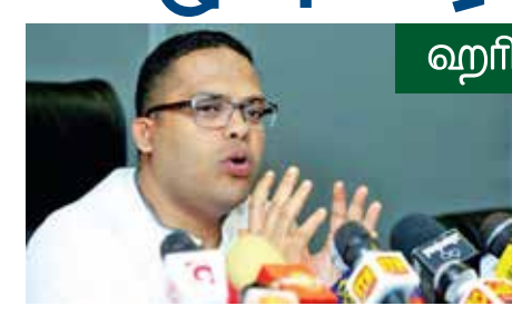
ஹரின் பெர்னாண்டோ எம்.பி. தகவல்

ஐக்கிய மக்கள் சக்தி கண்டியில் இருந்து கொழும்பு வரை 'சமகி ஜன பாகமன' என்ற பெயரில் எதிர்ப்புப் பேரணியை ஏற்பாடு செய்துள்ளது. 5 நாட்கள் நடைபெறும் இந்த ஆர்ப்பாட்டப் பேரணியானது எதிர்வரும் 26 ஆம் திகதி முதல் கண்டியில் இருந்து ஆரம்பமாகி 30ஆம் திகதி