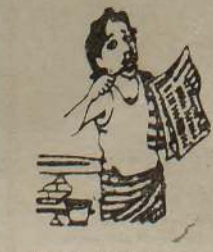
எச்சாம் தேர்தல் முடியும் மட்டும்தான் பாருங்கோ...

கொழும்பு, ஜூலை 11 நுவரெலியா மாவட்டத்தில் இந்த வாரத்தில் விடுதலைப் புலிகள் என்ற சந்தேகத்தி லே 20 இளைஞர்களை கைது யில் கைது செய்யப்பட்டனர் என்று தெரிவிக்கப்படுகிறது. கற்றி வந்ததை நடத்தப் பட்டிருக்கின்ற இளைஞர் சோதனைத் தடை முகாம களில் வைத்து இச்சந்தே கநபர்களை கைது செய்யப்பட்டனர் என்று - நுவரெலியாவில் காணும் இதில் வந்த தமிழர் குழுக்கு அச்செனரியம் ஏற்படுத்தாத விதத்தில் இந்த நடவடிக்கை (ஆ-எ-3)