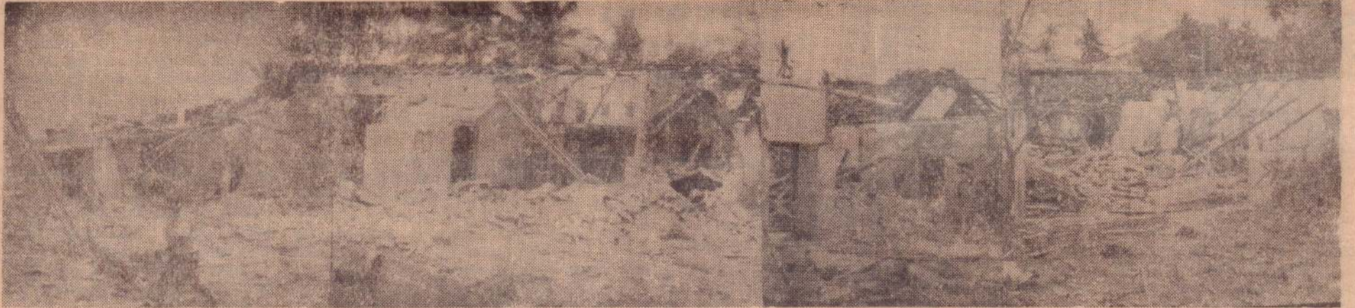
கடந்த வியாழன் யாழ்ப்பாணத்தில் சினத் தயாரிப்பான - 4 இயந்திரங் களினால் குருநகர், யாழ். சிவன்கோவிலடிப் பகுதிகளில் பல வீடுகள், கட்ட களைக் கொண்ட - பெரிய விமானத்திலிருந்து வீசப்பட்ட ராட்சதக் குண்டு டங்கள் தகர்ந்தன. அக் கட்டடங்களில் சிலவற்றை மேலே காணலாம்.

கடர்: 5 பிரமோதரத ஸ்ரீ ஆடி மீ 21 உ திங்கட்கிழமை (06-08-1990) ஹிஜ்ரி 1410 முஹர்ரம் பிறை 12 கதிர்: 156