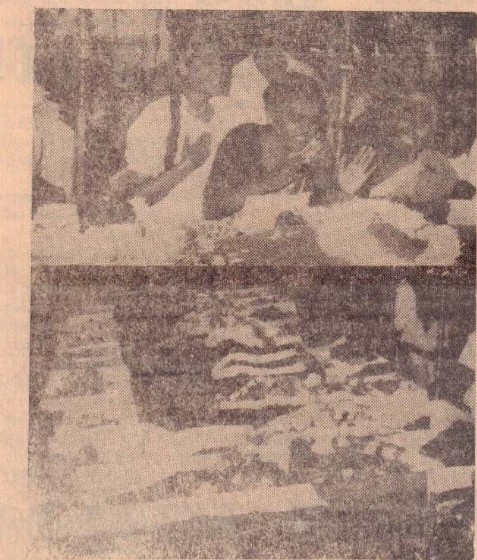
வீரமரணமடைந்த போராளிகளின் பூதவுடல்களுக்கு அவர்களது உறவினர்கள் அஞ்சலி செலுத்திய சோகக் காட்சி [உ-10]

முன்னால் காணப்பட்டனர். வடக்கு, கிழக்கு சம்பவங்கள் தொடர்பாக ஜம்ஆத் தொழுகையின் பின் ஆர்ப்பாட்ட ஊர்வலங்கள் எதுவும் நடைபெறாமல் தடுப்பதே இந்த பாதுகாப்பு ஏற்பாட்டின் நோக்கம் என்று கூறப்பட்டது. (உ)