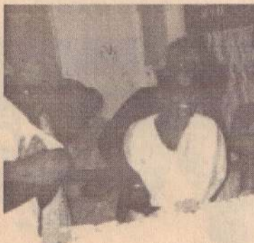
பான்மை தமிழர்களையும் பாதித்துள்ளது.

நூல் நிலையம் எரிக்கப்பட்ட போது, அடுத்தடுத்து தமிழ் மக்களுக்கு எதிராக கட்டவிழ்த்துவிடப்பட்ட இன வன்முறைகளின் போது தமிழ் மக்களின் பால் இருந்த அனுதாபம், மாறி இன்று தமிழர்களை வன்முறை மீது காதல் கொண்ட மனநோயாளர்கள் என்ற மாதிரியான நிலையை தோற்றுவித்துள்ளது. இந்த நிலை நாகரிகமான சாதாரண சராசரி பெரும்