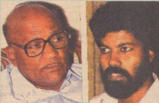
உரைகள் எளிதில் மறந்துவிட முடியாதவை.