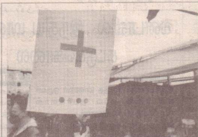
தற்காலிக மருத்துவ சிகிச்சை நிலையம்