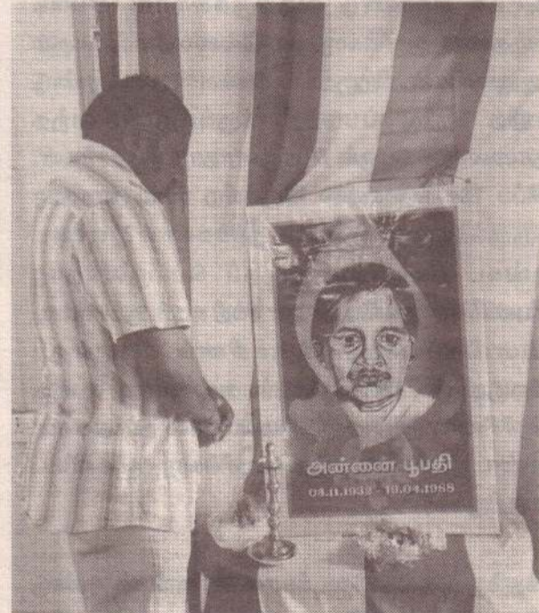
தியாக தீபம் அன்னை பூபதியின் 19ஆம் நாள் நினைவேந்தல், தமிழ்த் தேசிய மக்கள் முன்னணியின் யாழ். அலுவலகத்தில் நேற்றுமுன்தினம் கடைப்பிடிக்கப்பட்டது. (க-26)