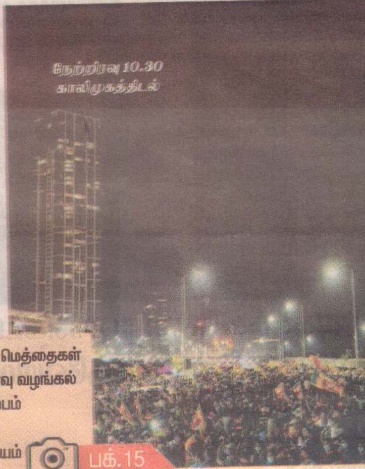
நேற்றிரவு 10.30 காலிமுகத்திடல்