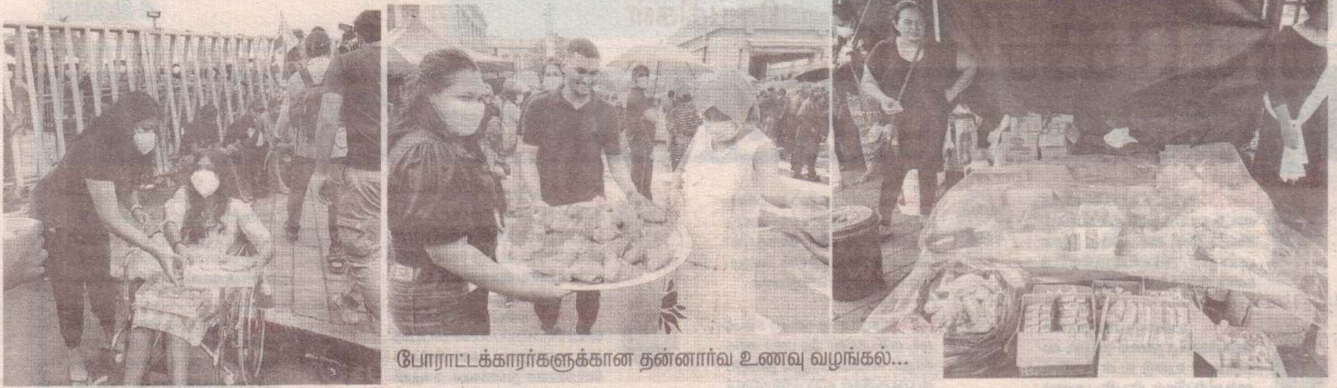
போராட்டக்காரர்களுக்கான தன்னார்வ உணவு வழங்கல்...