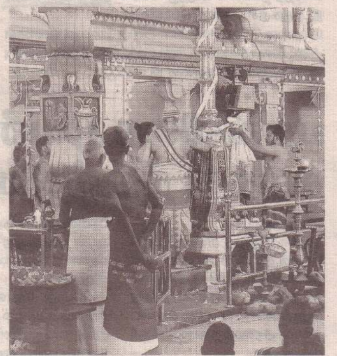
கைதடி வீரகத்திப்பிள்ளையார் ஆலயக் கொடியேற்றும் கடந்த திங்கட்கிழமை இடம்பெற்றது. (க-159)

பளை ஏப். 11 பளை இந்திராபுரத்திலுள்ள வீடொன்றினுள் நுழைந்த திருடர்கள் பெறுமதியான பொருள்களைத் திருடிச் சென்றுள்ளனர் எனத் தெரிவிக்கப்படுகிறது. இந்தச் சம்பவம் கடந்த 7ஆம் திகதி இரவு இடம்பெற்றுள்ளது. வீட்டைப் பூட்டிவிட்டு உறவினர் வீட்டுக்குச் சென்று காலையில் வந்து பார்த்தபோது கதவு உடைக்கப்பட்டு உள்ளிருந்த நீரிறைக்கும் இயந்திரம், மின்மோட்டர், விநியோக குழாய்கள் மற்றும் பாத்திரங்கள் எனப் பெறுமதியான பொருள்கள் திருடப்பட்டிருந்தன என வீட்டின் உரிமையாளர் பளை பொலிஸ் நிலையத்தில் முறைப்பாடு செய்துள்ளார். சம்பவம் தொடர்பில் பளைப் பொலிஸார் மேலதிக விசாரணைகளை மேற்கொண்டு வருகின்றனர். (ச-9)