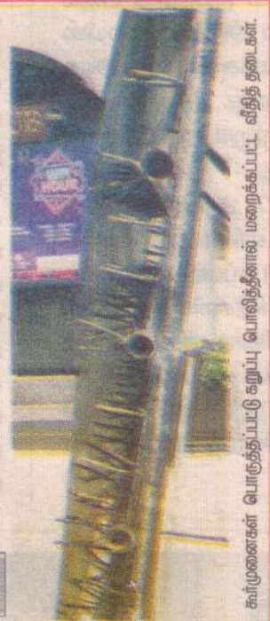
கம்பிகளைப் பொருத்தப்பட்டு கறுப்பு பொலித்தீனால் மறைக்கப்பட்ட வீதித் தடைகள்.

கொழும்பை அண்மித்துள்ள ஒரு சில வீதிகளில் ஏற்படுத்தப்பட்டுள்ள வீதித் தடைகளில் கூரிய ஆணி போன்ற கம்பிகளைப் பொருத்தி கறுப்பு நிற பொலித் தீனால் மறைத்து வைக்கப்பட்டுள்ளதாக இலங்கை சட்டத்தரணிகள் சங்கம் தெரிவித்துள்ளது. இதன் காரணமாக மக்களுக்கு காயங் 15