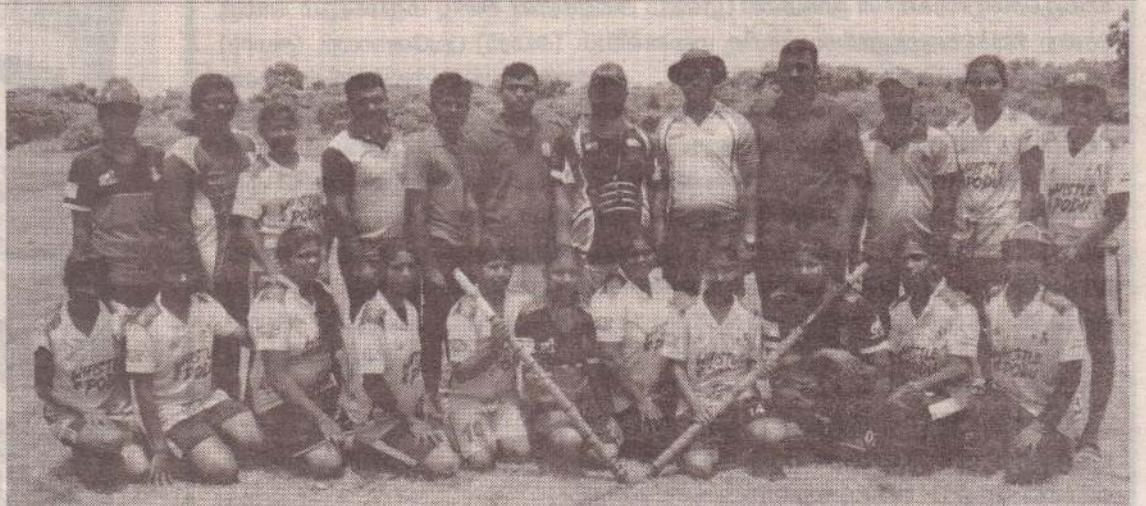
தென்மராட்சிப் பிரதேசத்தில் பதிவுசெய்யப்பட்ட விளையாட்டுக் கழகங்களுக்கு இடையிலான எல்லே தொடரில் பெண்கள் பிரிவில் வரணி இளைஞர் அணி வெற்றிபெற்று இவ்வருட சம்பியனானது. நாவற்குழி காந்தி அணியை வீழ்த்தியே வரணி இளைஞர் அணி கிண்ணம் வென்றது. (ம-9)