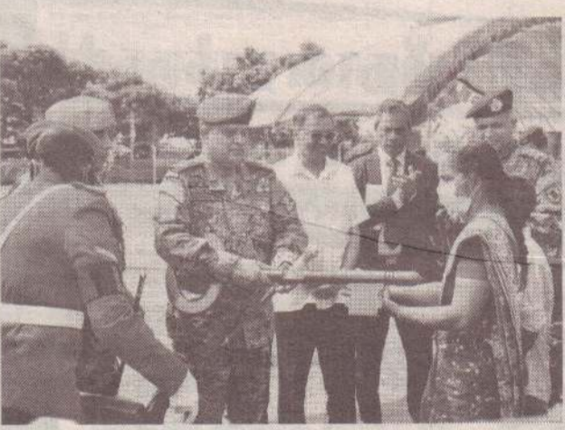
இராணுவத் தளபதி சவேந்திர சில்வா யாழ்ப்பாணத்துக்கு நேற்றுமுன்தினம் சுற்றுப்பயணம் மேற்கொண்டுள்ள நிலையில், அவரால் தெரிவுசெய்யப்பட்ட பயனாளிக்கு வீடும், தெரிவுசெய்யப்பட்ட மாணவர்களுக்கு பாடசாலை உபகரணங்களும் வழங்கப்பட்டன. (ய-20)