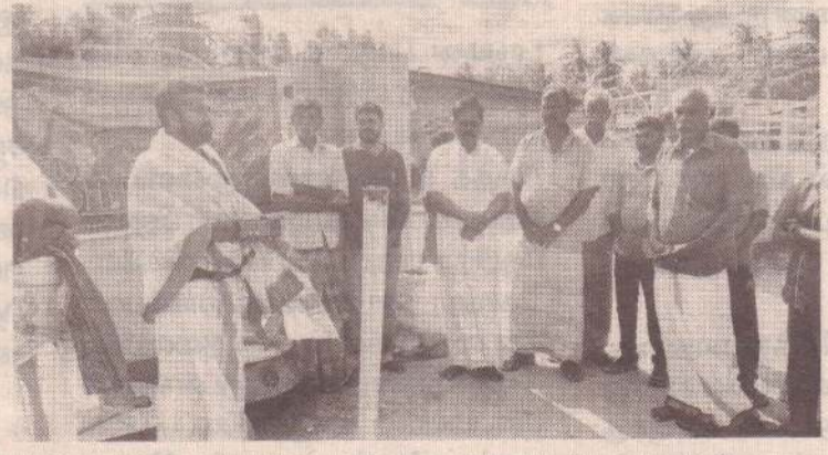
கிளிநொச்சி- வட்டக்கச்சி பொதுச்சந்தையில் முள்ளிவாய்க்கால் நினைவுக் கஞ்சி நேற்று வழங்கப்பட்டது. அத்துடன் 2009ஆம் ஆண்டு இனப்படுகொலையின் நினைவாக நினைவுச் சுடரும் ஏற்றப்பட்டது. (ம-14)

யாழ்ப்பாணம், மே 17 முள்ளிவாய்க்கால் இனப்படுகொலை வாரத்தின் 4ஆம் நாள் நினைவேந்தல் நாகர்கோவில் மகா வித்தியாலயத்தில் நேற்றுமுன்தினம் கடைப்பிடிக்கப்பட்டது. முள்ளிவாய்க்காலில் கொத்துக்கொத்தாக செத்துமடிந்த உறவுகளுக்காக மட்டுமல்லாது, 1995ஆம் ஆண்டு நாகர்கோவில் மகா வித்தியாலயத்தில் சிறிலங்கா விமானப் படையினரின் குண்டு வீச்சால் படுகொலை செய்யப்பட்ட 39 மாணவர்களுக்கும் இந்த நினைவேந்தலில் சுடரேற்றி மலரஞ்சலி செலுத்தப்பட்டது. (ம-14)