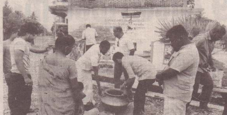
முள்ளிவாய்க்கால் இனப்படுகொலை வாரத்தின் நான்காவது நாளை முன்னிட்டு அம்பாவை- வரமுனை படுகொலை நினைவுத்தூபியில் நேற்றுமுன்தினம் முள்ளிவாய்க்கால் கஞ்சி பொது மக்களுக்குப் பகிர்ந்தளிக்கப்பட்டது. (ம-14)