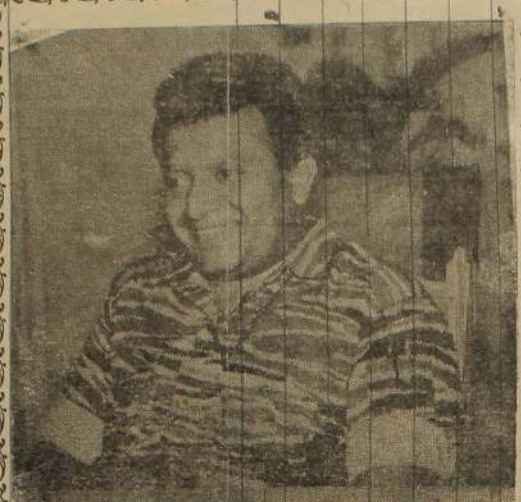
தமிழீழ தேசிய தலைவர் திரு.வே. பிரபாகரனுக்கு இன்று அகவை நூற்று பது நிறைவு விழா. அவர் பல்லாண்டு பயண கண்டு நீடுழி வாழியவே!

மாண்புமிகு தலைவர் பிரபாகரன் இன்றிரவு உரையாற்றுவார். இரவு 9 மணி முதல் 12 மணிக்கு மாண்புமிகு தலைவர் பிரபாகரன் இன்றிரவு உரையாற்றுவார். இரவு 9 மணி முதல் 12 மணிக்கு மாண்புமிகு தலைவர் பிரபாகரன் இன்றிரவு உரையாற்றுவார்.